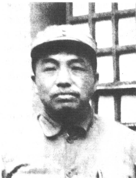
国民革命军八路军副总指挥彭德怀

准确地说，1940年8月，八路军总部在敌后发动了一场大规模的交通破袭战，而非百团大战。百团大战是根据战役发展的规模而后定名