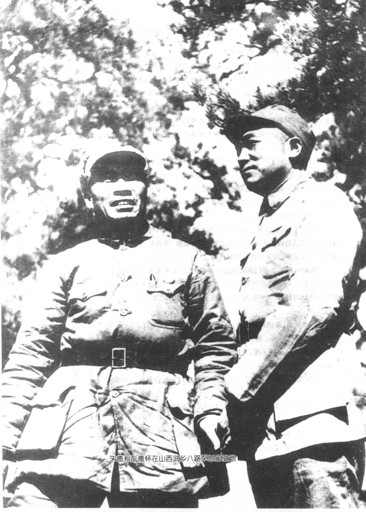
朱德和彭德怀在山西武乡八路军总部驻地