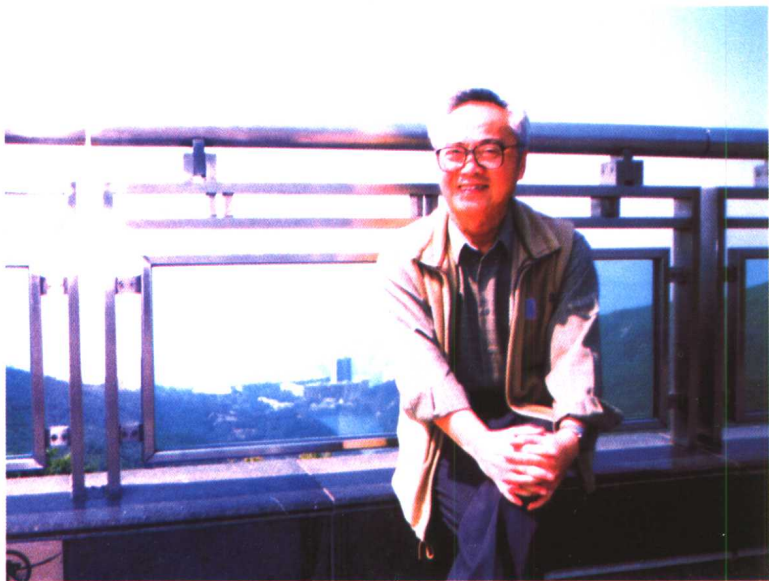
作者近影 (摄于1997年12月)