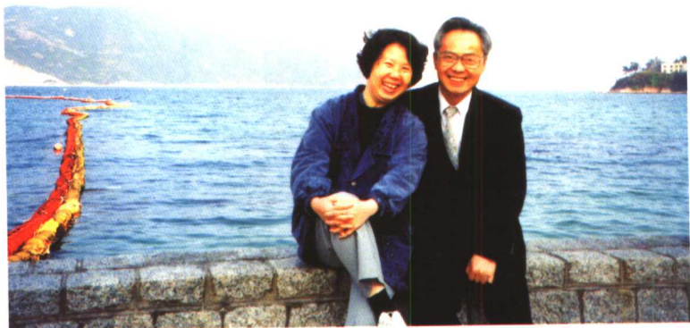
▲ 作者与夫人 1997 年摄于香港