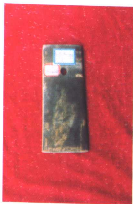
惠民县出土的玉钺 (岳石文化)