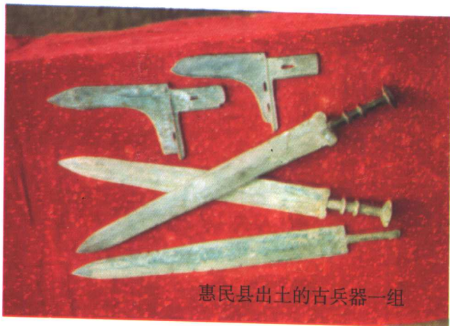
惠民县出土的古兵器一组