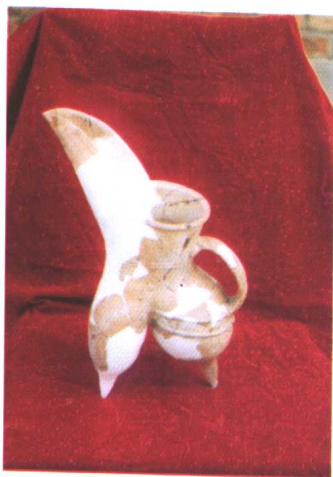
惠民县出土的陶罍 (龙山文化)