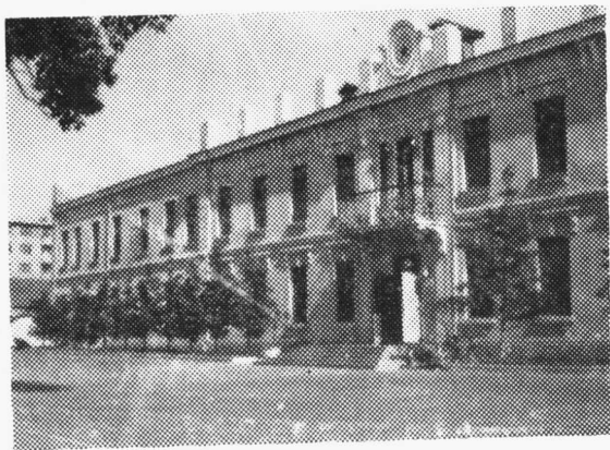
一九四五年中共齐齐哈尔市委（工委）办公地址（现齐齐哈尔军分区征兵办公室）。