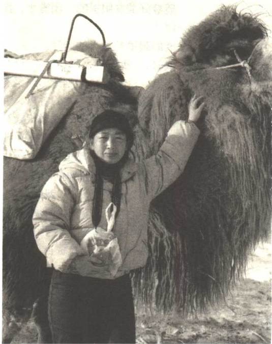
◎我的新伙伴