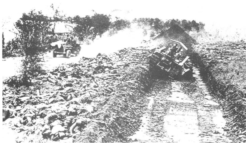
●美军攻占塞班岛后，日本守军尸横遍野。