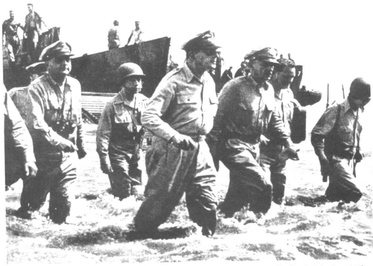
● 1944年10月，麦克阿瑟将军率领盟军部队在莱特岛涉水登陆，开始了收复菲律宾的战斗。