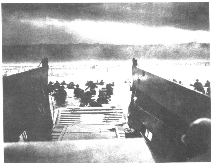
● 1944年6月6日至7月18日，盟军在法国西北部诺曼底实施了登陆作战计划，从而加速了德国法西斯的灭亡。