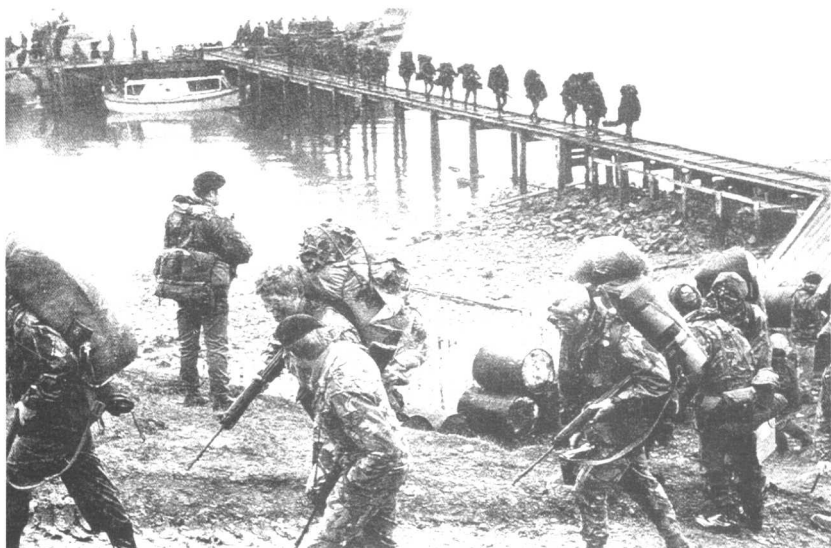
● 英国海军陆战队登上马岛。