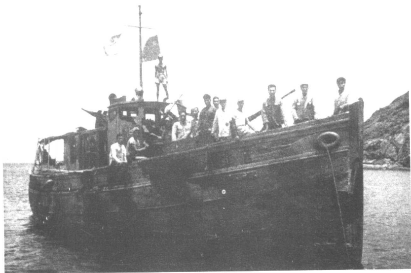
●在解放海南岛、舟山群岛战役中，以木船打败敌军舰，多次荣立战功的“奋斗号”。