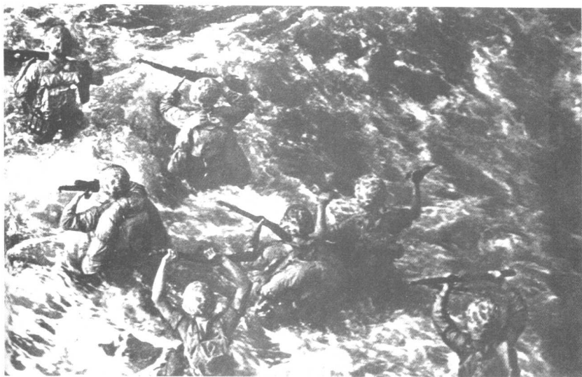
●美国海军陆战队在与日军的新不列颠战役中艰难地涉水登陆。