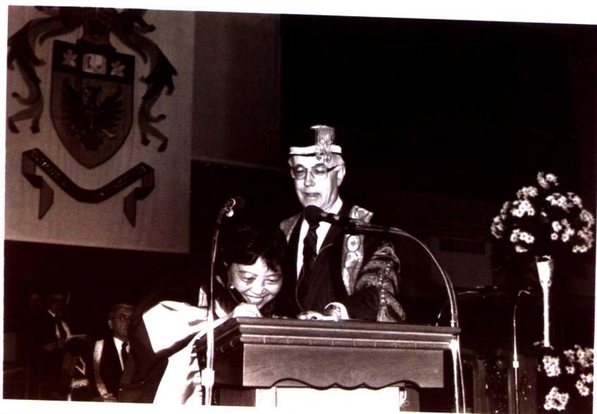
Signed on the certificate of honorary doctoral degree issued by the Chancellor of McMaster University 1990