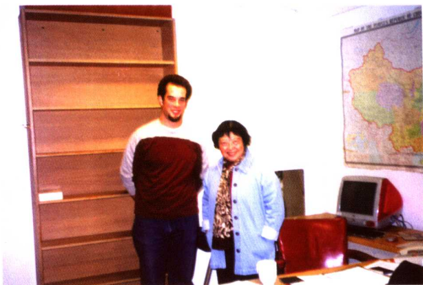
Tutoring a student in the office of Stanford University in America