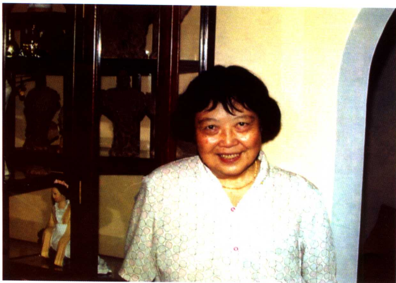
At HongKong University in 1993