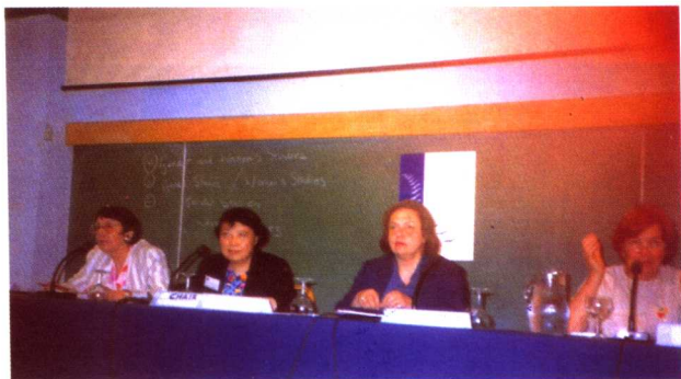
At Women's Conference held in Athens of Greece 1991