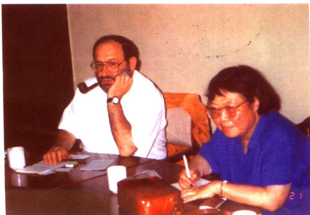
At a conference with Italian writer and theorist Umberto Eco in 1993