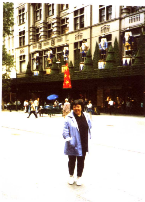
Around Melbourne University in Australia, 1995