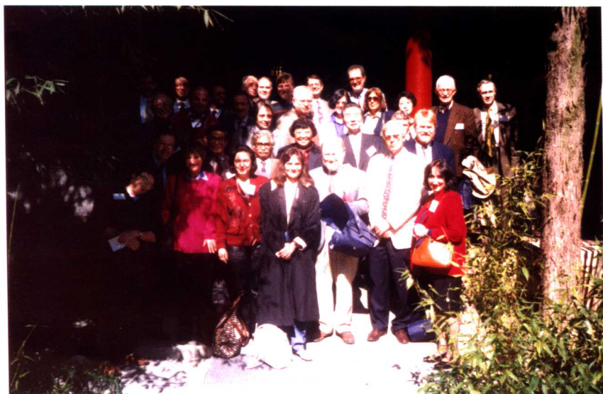
The Council of International Comparative Literature Association firstly held in China 1998