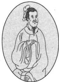
鲁逸仲 生卒年不详，字方平，号嗤鼻先生。北宋哲宗元祐（1086—1093年）中隐士。