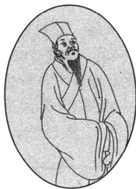
李 玉 生平事迹不详。词仅存一首。