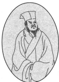
吕滨老 生卒年不详，一作渭老。字圣求，嘉兴（今属浙江）人。宣和间以诗名。词风婉媚深窈。有《圣求词》。