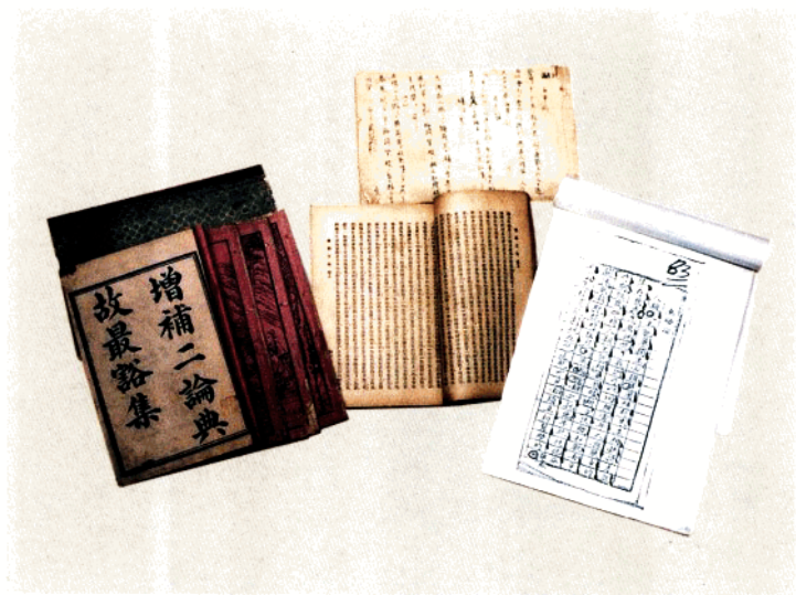
李佐民烈士读过的书籍和使用的文簿、笔记等