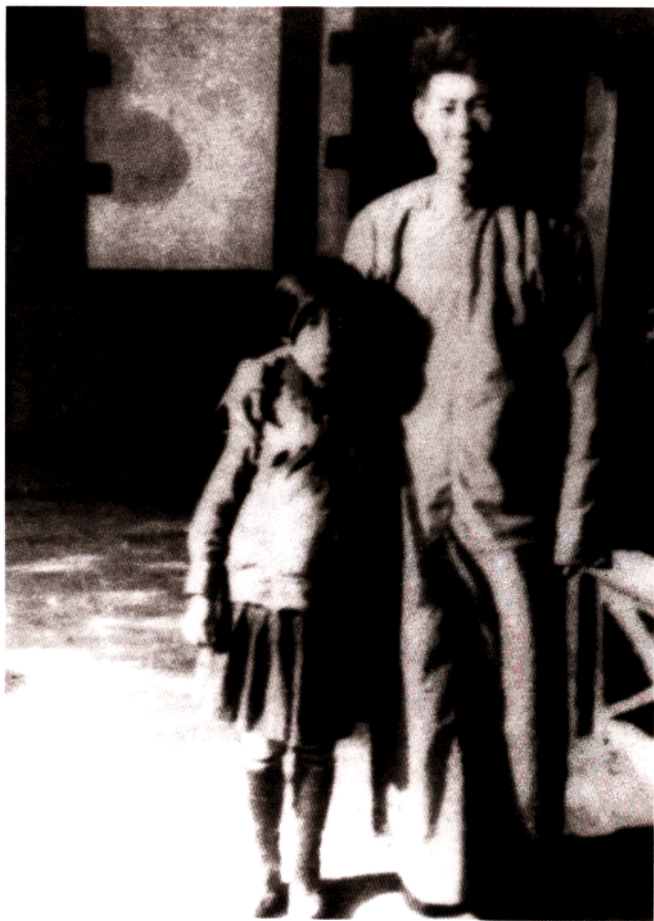
李佐民烈士生活照