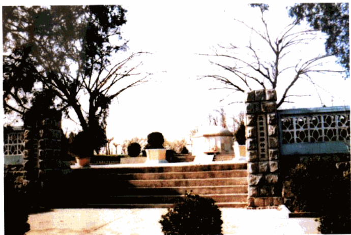
李佐民烈士陵园墓