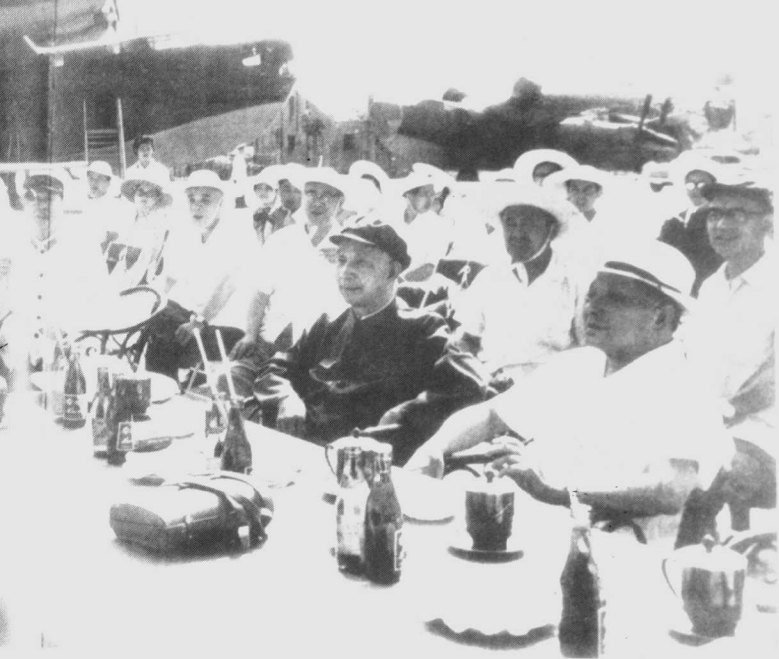
1979年7月,粟裕(前排右二)陪同邓小平(前排右一)视察海军北海舰队海军航空兵部队时,观看飞行表演。