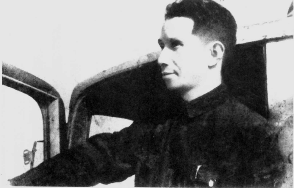
1946年，指挥苏中七战七捷时的粟裕。