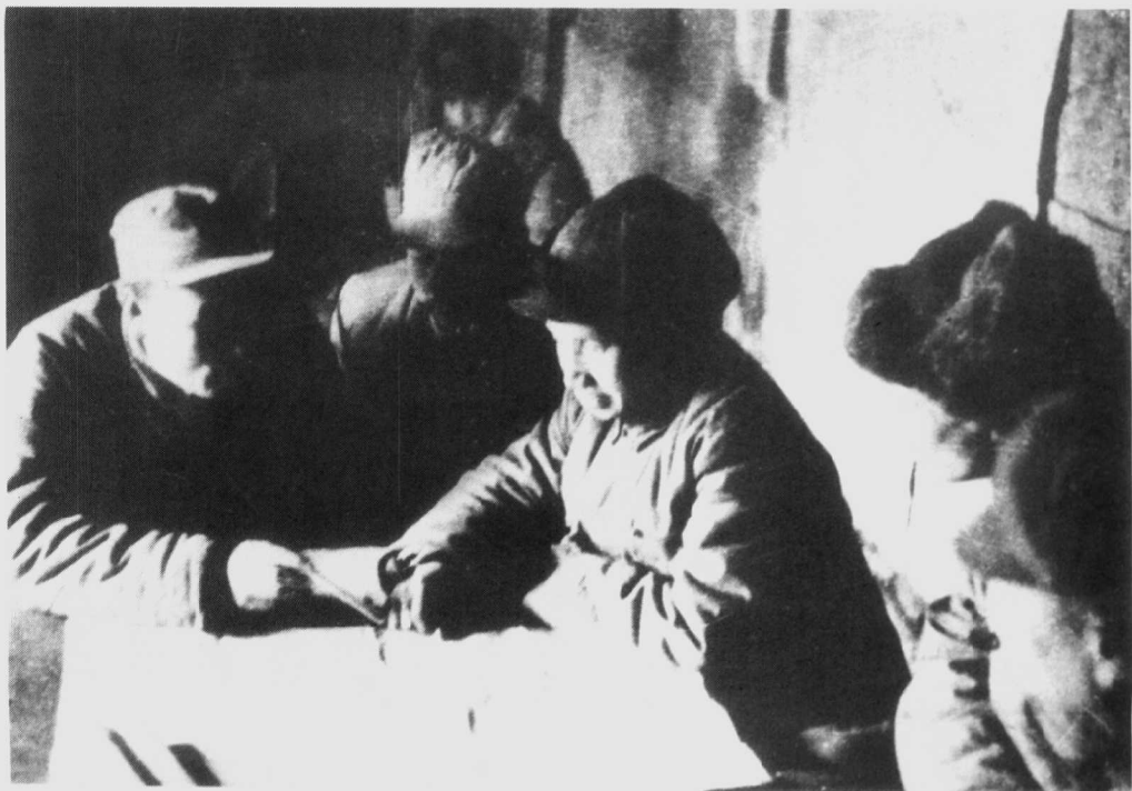
1948年冬,华东野战军代司令员兼代政委粟裕(中)在指挥淮海战役。