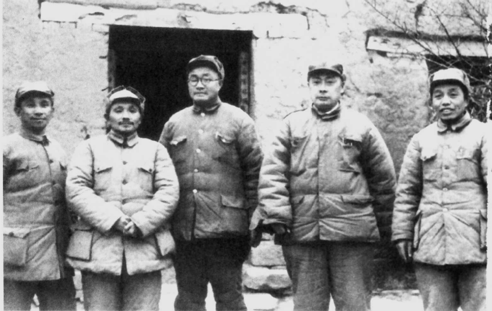
1948年11月16日,中央军委决定成立淮海前线总前委。这是总前委成员在一起。左起:粟裕、邓小平、刘伯承、陈毅、谭震林。