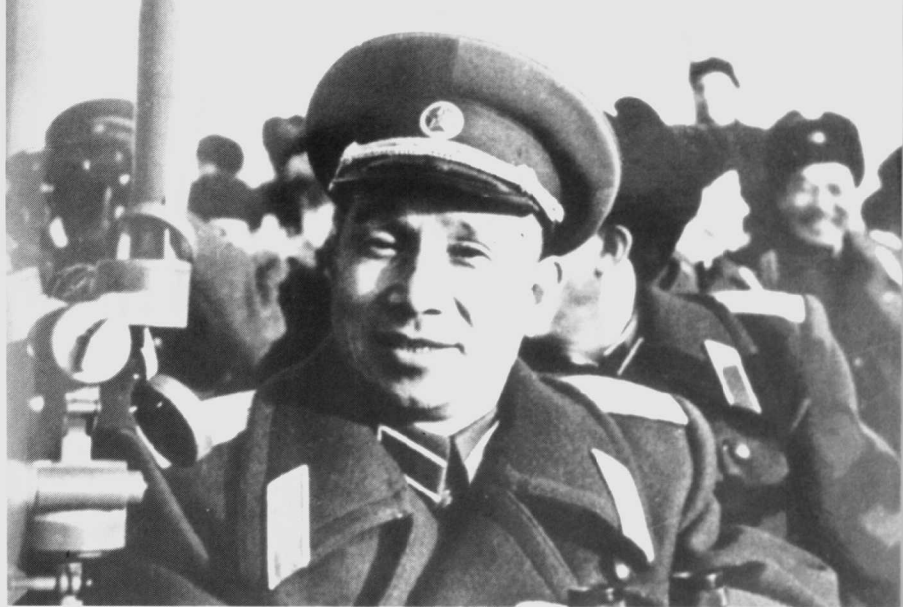
1955年冬，粟裕总参谋长参加指挥辽东半岛抗登陆军事演习。