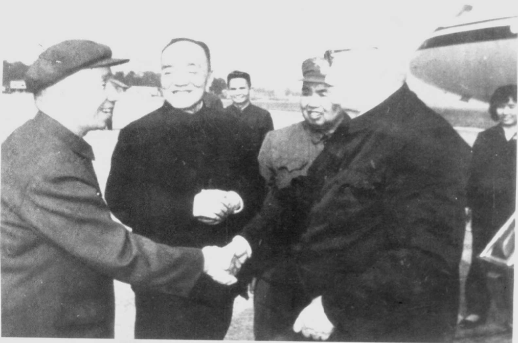
▼1980年1月,于广州白云机场,粟裕(左一)与叶剑英(前右一)、杨尚昆(左二)、许世友(前右二)在一起。