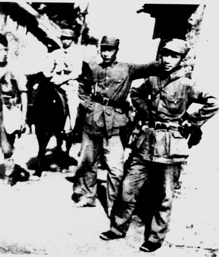
1940年,粟裕(右一)、陈毅(右二)在苏北黄桥战役前夕。