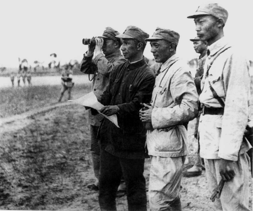
1947年，粟裕(左二)在孟良崮战役前线。