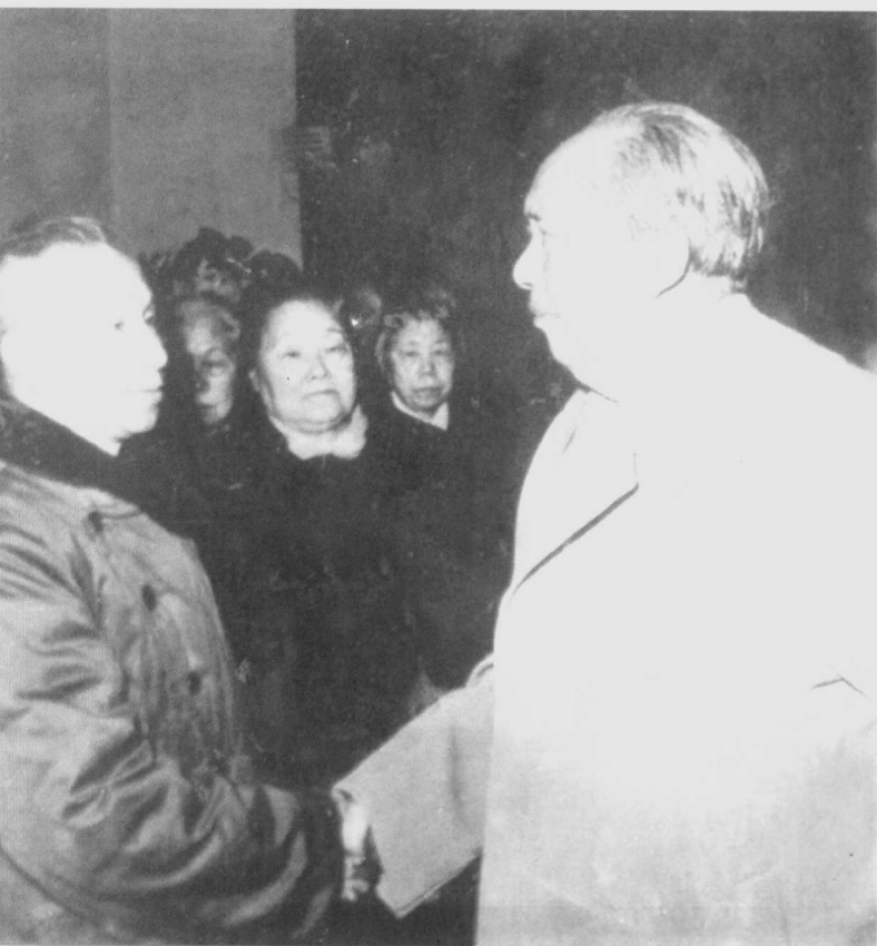
1972年1月， 毛泽东同志与粟裕 同志在一起。