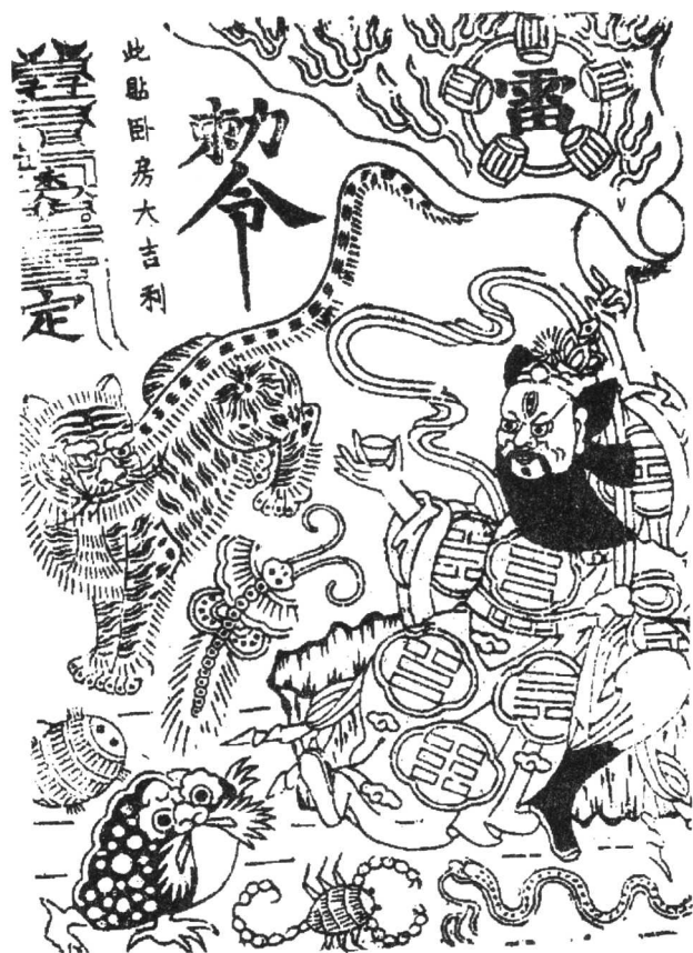
图 1-3 五毒天师符

为禁忌，而是一种劝人行善的箴言或一种普遍的常识了。‘不要把手放在火中’，这句话并不是禁忌，而只是一种常识性的道理。因为这种行为如不禁止，必然要造成实在的后果，而不是一种想象的不幸。”（詹·乔·弗雷泽：《金枝》上册）禁忌是不讲道理的，某种语言、某种行为或接触某种人、物与人们认为要降临的恶果之间根本就没有任何直接的联系。（3）然而，禁忌的处罚又是不可抗拒的。否则，禁忌就失去了威慑力，也就不复存在了。破坏禁忌所遭受的惩罚由精神上的或当事人自发的内心力量来实行。