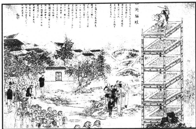
图 1-1 以术驱蝗 采自《点石斋画报》

因流传的久远，加上禁忌民俗特有的神秘性，现已难以确定其具体的根源，但并非乌有。另外，企图寻求适合所有禁忌民俗的终极原因是徒劳的。禁忌民俗的起因不是单一的，西方的各种禁忌民俗发生论不可能得到所有禁忌民俗的验证。如何才能形成一条禁忌，这是一个只能在具体的社会生活中被解决的问题。只要人类没有彻底地认识自然，控制自然，禁忌就会以各种方式、各种渠道不知不觉地出现在人们身旁，成为约束人们言行的不成文的规矩。