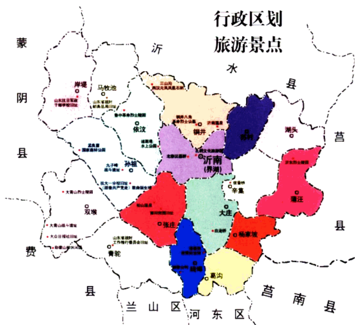
沂南县地理位置示意图