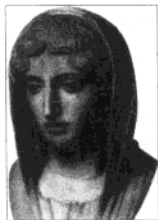
300 这是伯里克利的妻子阿斯帕西娅的塑像。

伯里克利的对外政策以扩大雅典的势力和利益为根本原则，力图在加强控制提洛同盟的基础上，抗击以斯巴达为首的伯罗奔尼撒同盟，建立雅典在希腊世界海陆两方面的优势和主权。经过努力，伯里克利主持完成了雅典与比雷埃夫斯港之间的城墙修建工程，既加强了陆地防御能力，更确保了雅典与海上的交通联系。伯里克利尽力扩大雅典的军事力量，加强控制提洛同盟，抑制以斯巴达为首的伯罗奔尼撒同盟，企图建立雅典在希腊世界海陆两方面的霸权。后经过一系列的政治和军事的努力，伯里克利领导下的雅典在希腊半岛的势力达到顶点。