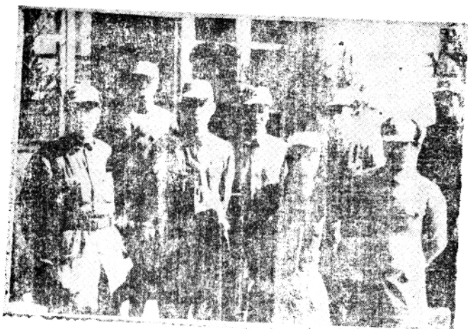
1942年4月，刘少奇同志在临沭县朱樊村王家花园与山东抗日根据地党政军主要负责同志合影。前排左起：黎玉、刘少奇、肖华、罗荣桓；后排左起：朱瑞、陈光、陈士榘