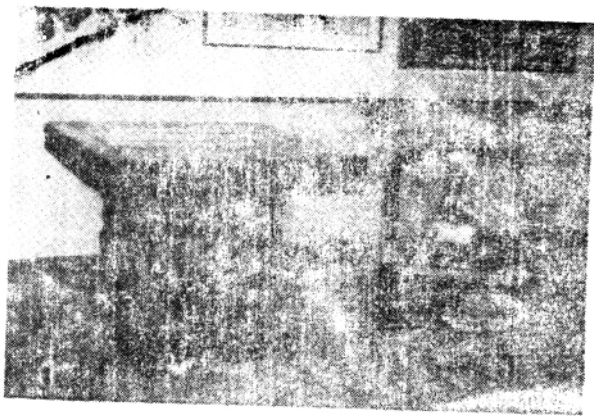
刘少奇同志在朱樊村用过的办公桌椅