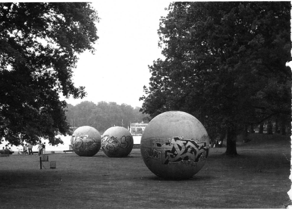
C. 奥尔登伯格 要命的巨型游泳池 混凝土制品 1987