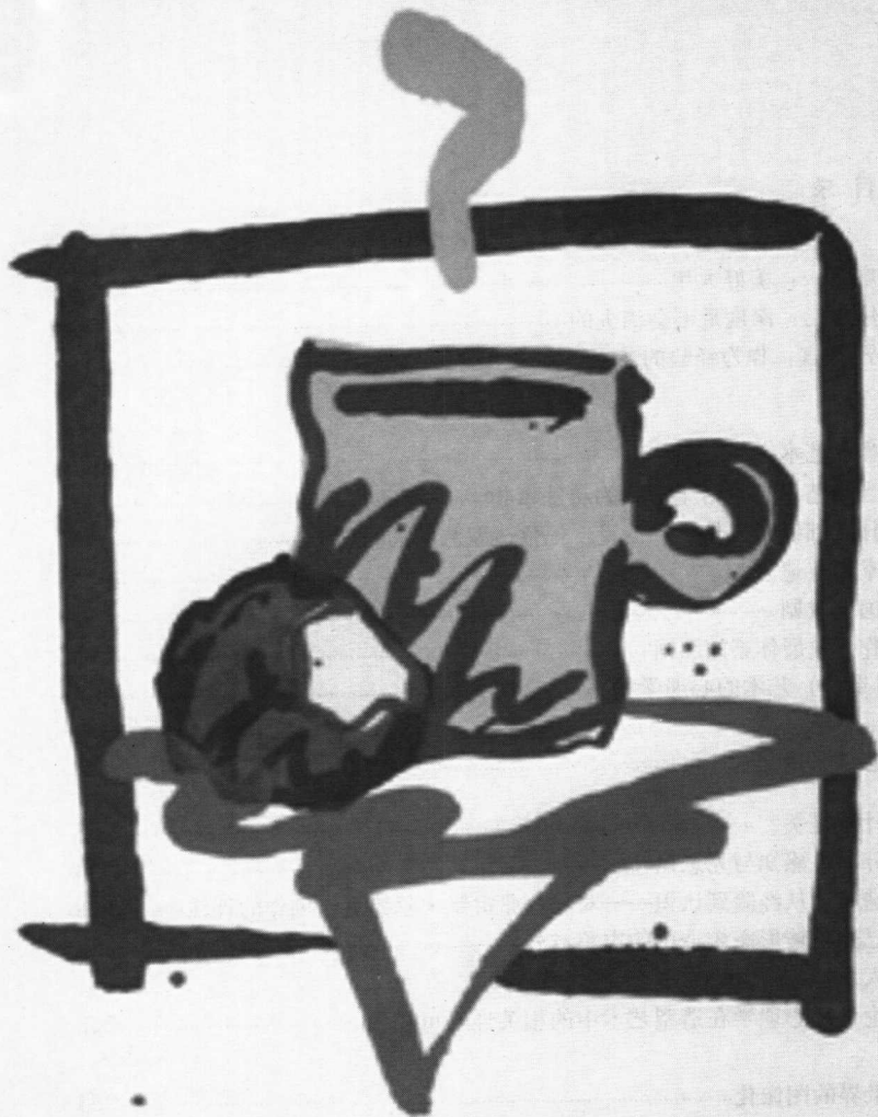
C. 奥尔登伯格 乔的带有回旋加速器的杯 雕版-印刷 61 cm x 49 cm 1995