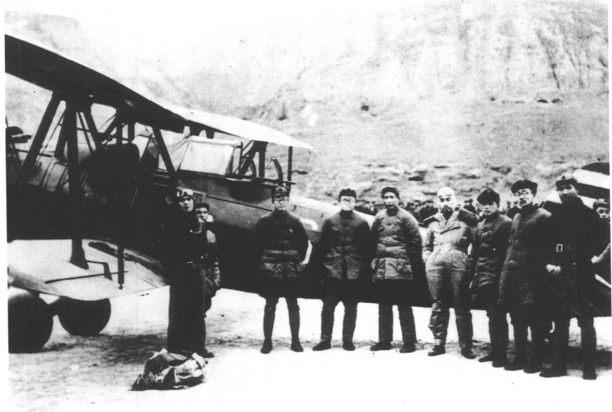
5 一九三七年四月在延安机场迎接周恩来 右起：萧劲光、林伯渠、彭德怀、周恩来、毛泽东、张闻天、秦邦宪