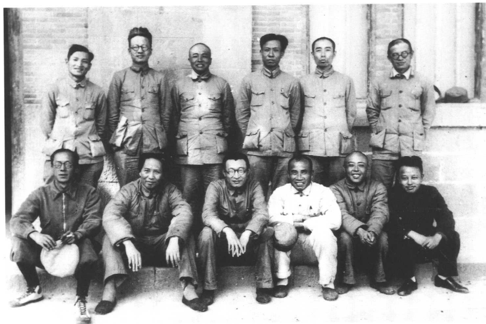
6 参加中共六届六中全会的中央政治局委员合影 前排右起：王明、项英、朱德、王稼祥、毛泽东、康生；后排右起：张闻天、周恩来、刘少奇、彭德怀、秦邦宪、陈云