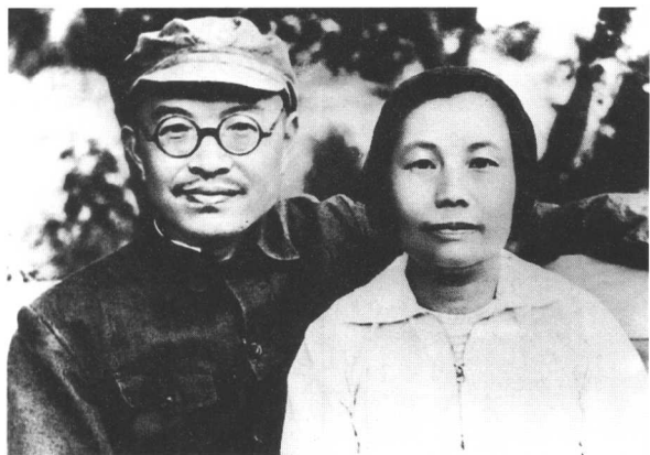
7 一九三九年春刘英从莫斯科归来合影于延安枣园