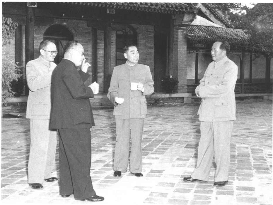
14 一九五六年十月四日张闻天同毛泽东、 周恩来、陈毅在一起