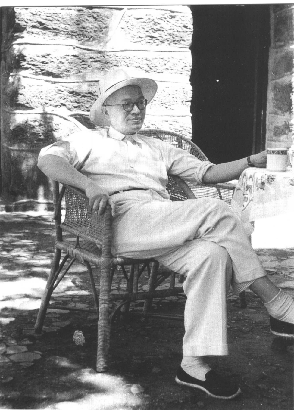
15 一九五九年七月在庐山