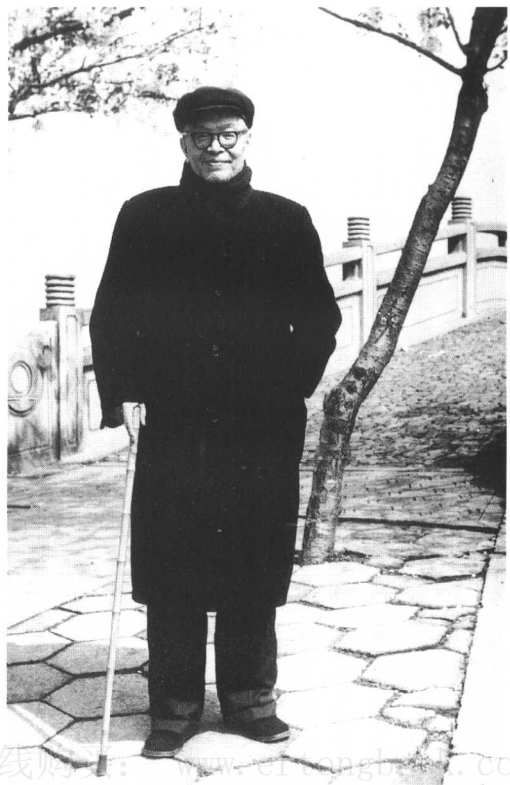
18 一九七六年春在无锡鼋头渚长春桥畔