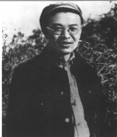
8 一九四二年九月于米脂县杨家沟