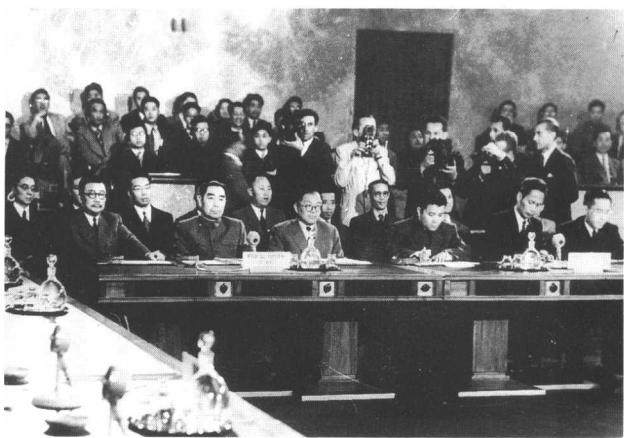
13 一九五四年七月在日内瓦会议会场上 第一排左起：李克农、周恩来、张闻天