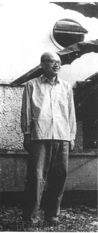
17 一九七三年十月在广东肇庆住处