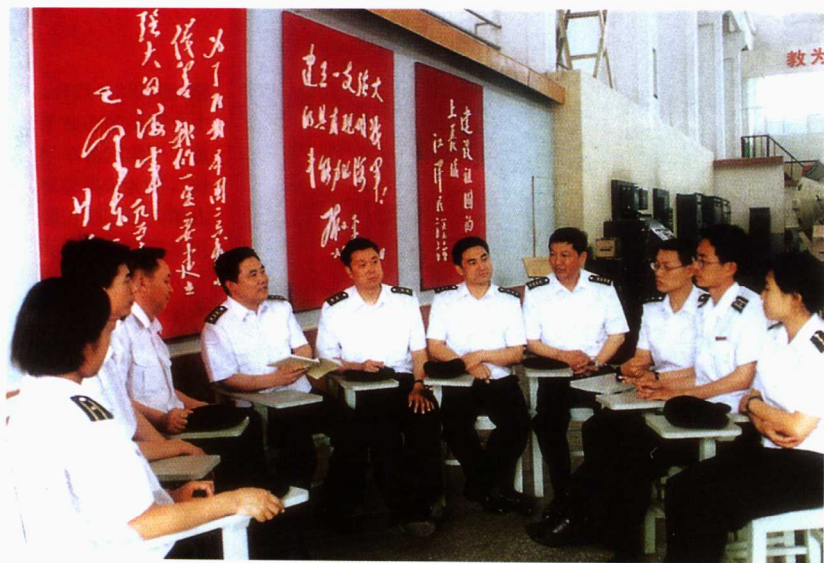
■开展“人民海军忠于党”教育活动，强化官兵理想信念和奉献意识