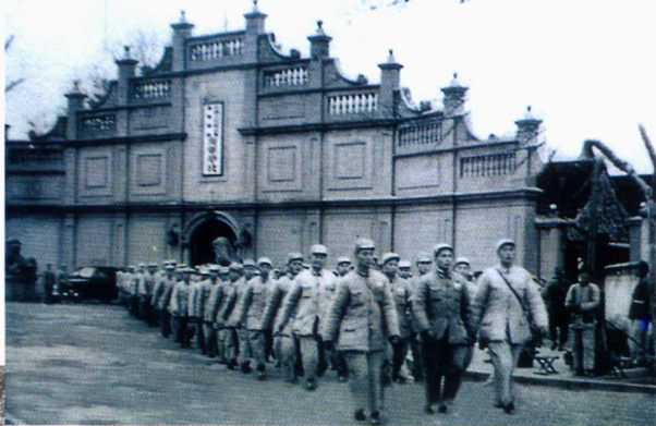
■南京海军学校旧址，潜艇学校第一期学员大部分从这里调来