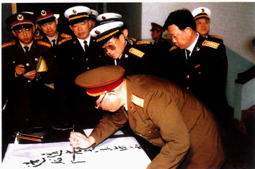
■ 1994年，军委副主席张震来学院视察