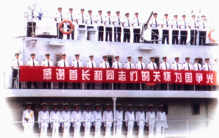
■教员参加远航和军事演习