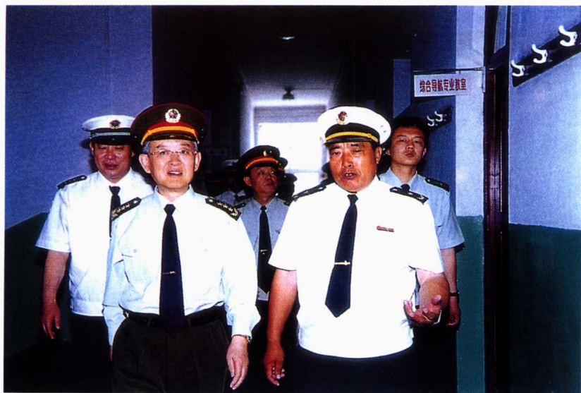
■ 2001年，总政治部主任于永波来学院视察