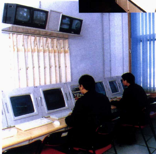
■ 航海模拟训练中心