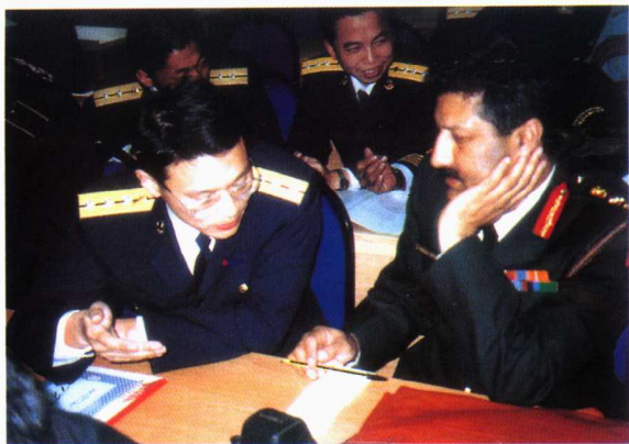
■ 研究生学员与来 访外宾亲切交谈