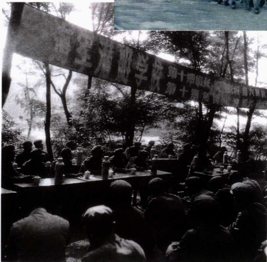
■1973年10月，“文革”中被撤消的潜艇学校恢复开学，图为在树林中举行的开学典礼