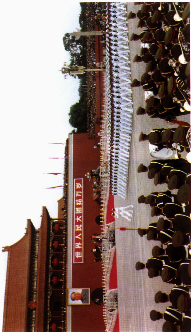
■ 1999年10月1日，潜艇学院水兵方队在国庆50周年阅兵庆典中通过天安门广场