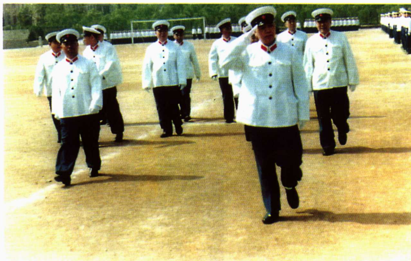
■ 1983年，军委副主席刘华清（原海军司令员）来学院视察