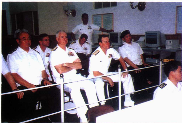
■ 2000年8月， 美国太平洋舰队司令法戈上 将来学院参观 访问