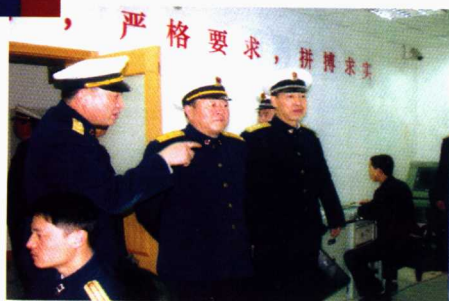
■ 现任海军政委胡彦林2003年 视察潜艇学院