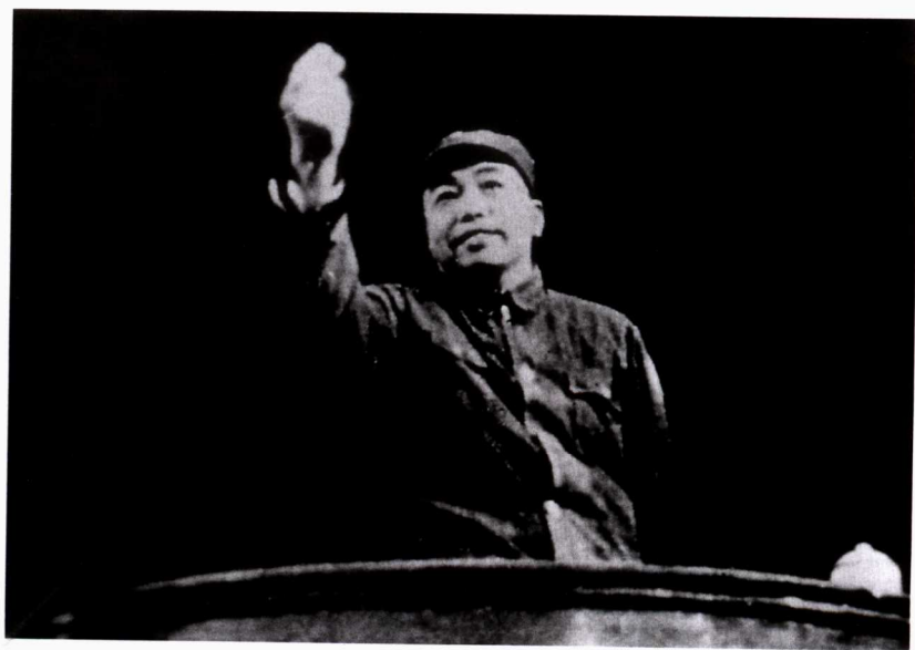
■ 1955年9月，彭德怀司令员视察海军潜艇学习队