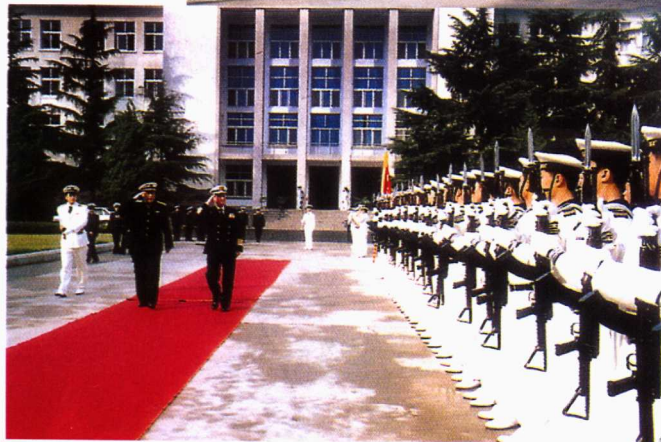
■ 2002年11 月，西班牙海 军参谋长托 伦特上将率 海军代表团 来学院访问