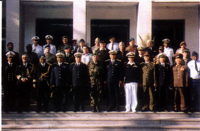
■ 2001年10月， 31个国家驻华 武官组成的代 表团访问学院