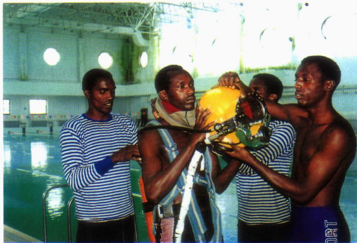
■ 在潜艇学院学习的外国留学生