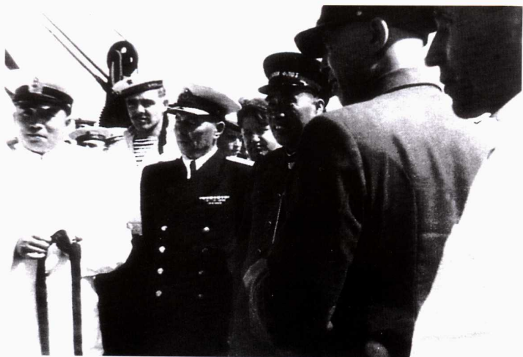
■ 1953年春天，朱德总司令、刘伯承院长视察海军潜艇学习队