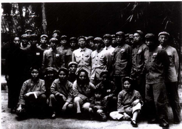
■1953年8月13日，中央军委颁布命令成立“第四海军学校”，图为来青岛筹办第四海军学校即潜水艇学校的川北军区直属机关部分人员