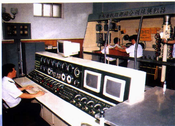
■ 战术指挥模拟训练中心