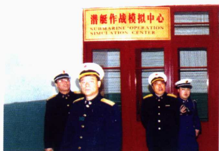
■ 现任海军司令员张定发2001年 视察潜艇学院