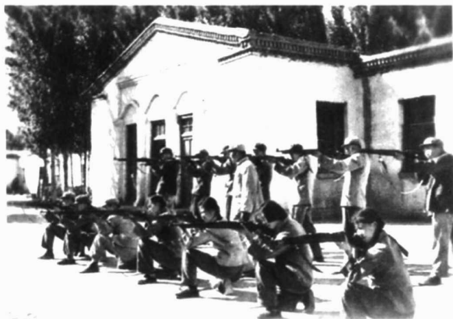
左图：支边知识青年民兵训练的飒爽英姿。