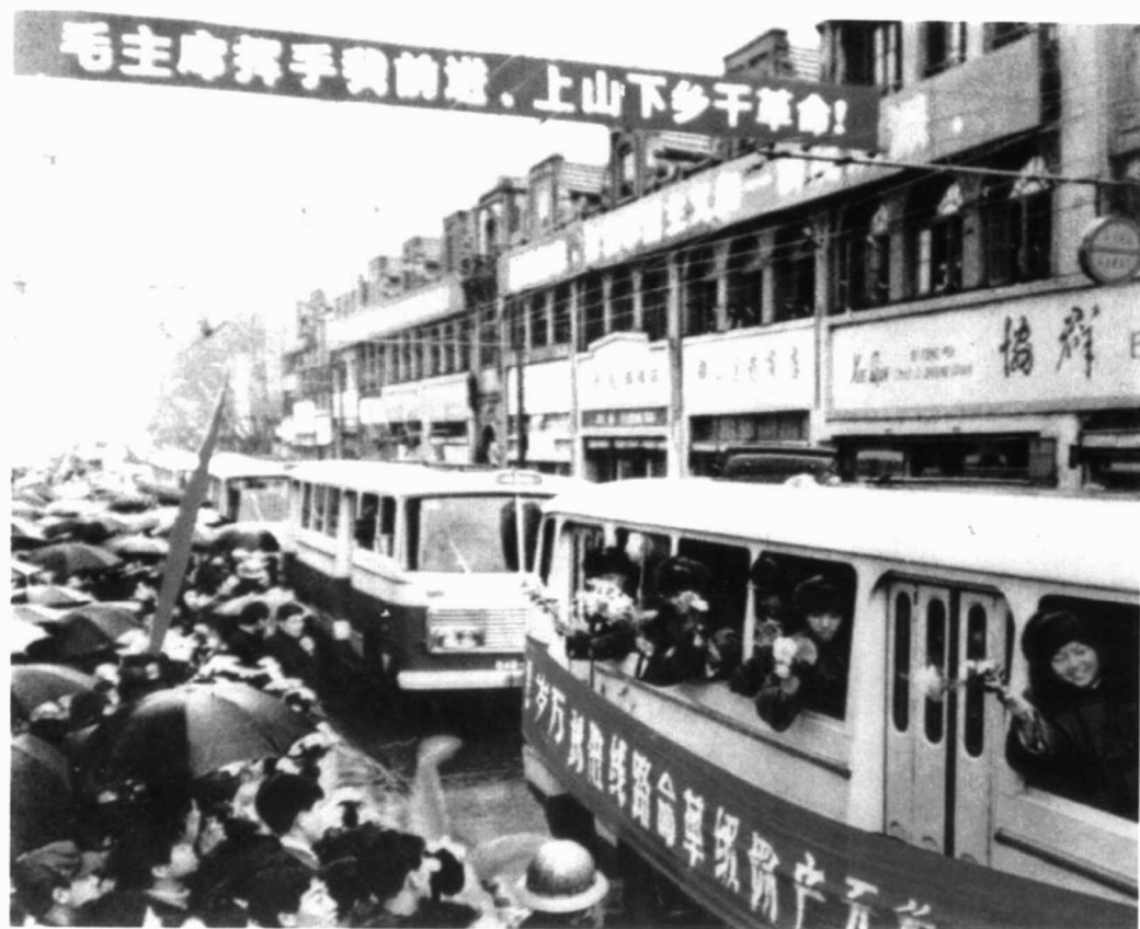
上海各区送支青去火车站途中。