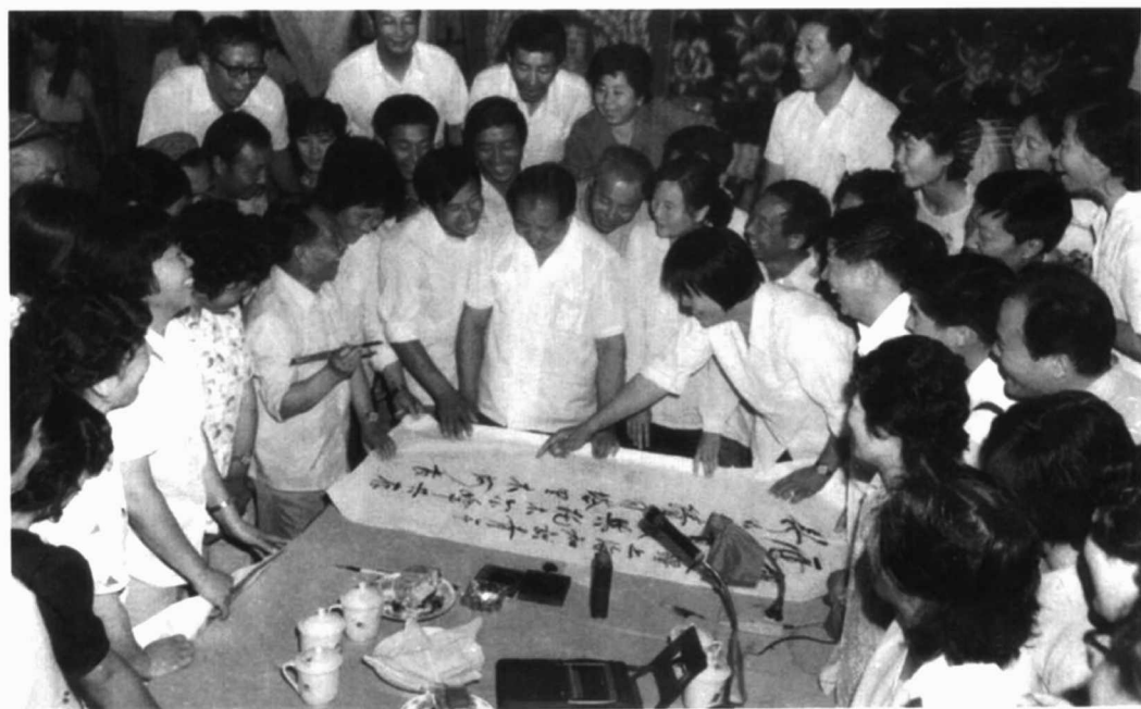
1985年7月25日,胡耀邦总书记在农一师看望上海支边青年。