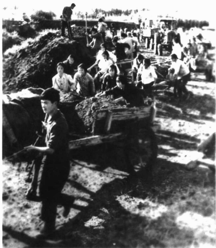
左图：上海支青在连队拉沙改土场面。