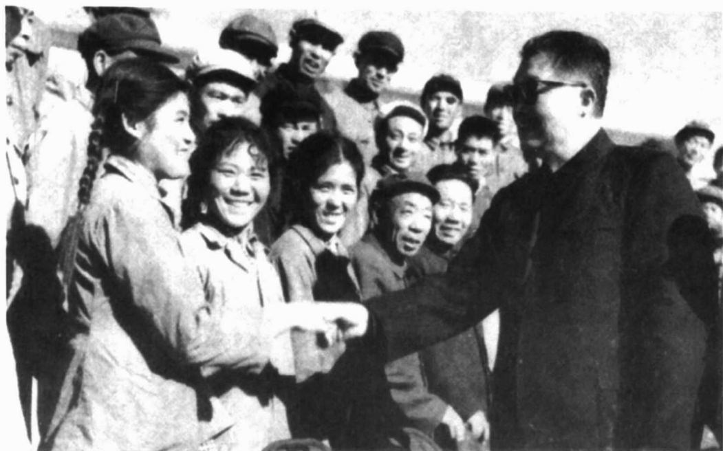
1965年10月10日,贺龙副总理在喀什接见农一师老红军、老八路及上海支边青年代表。