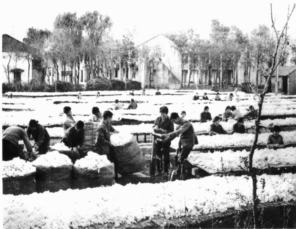
下图：农一师上海支青翻晒棉花场面。