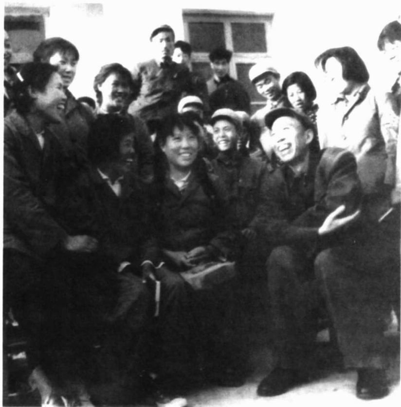
农垦部王震部长和上海支边知识青年亲切交谈。