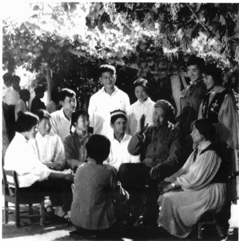
老红军向青年们讲述革命传统。