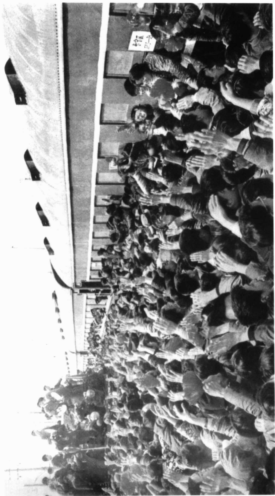
上海支边知识青年出发时火车站送行场面。