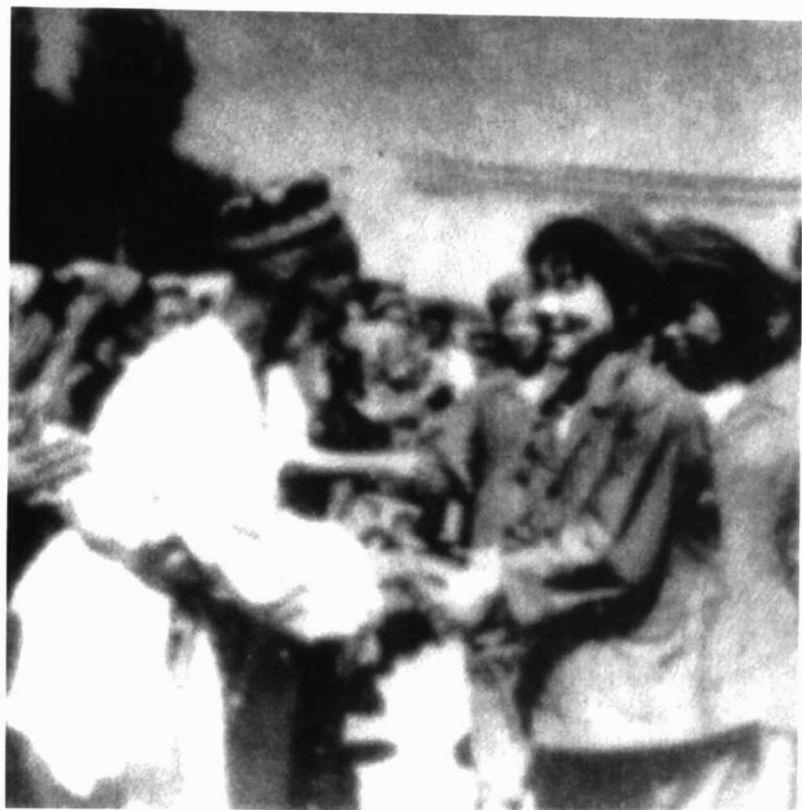
阿克苏各族人民欢迎上海支边知识青年。