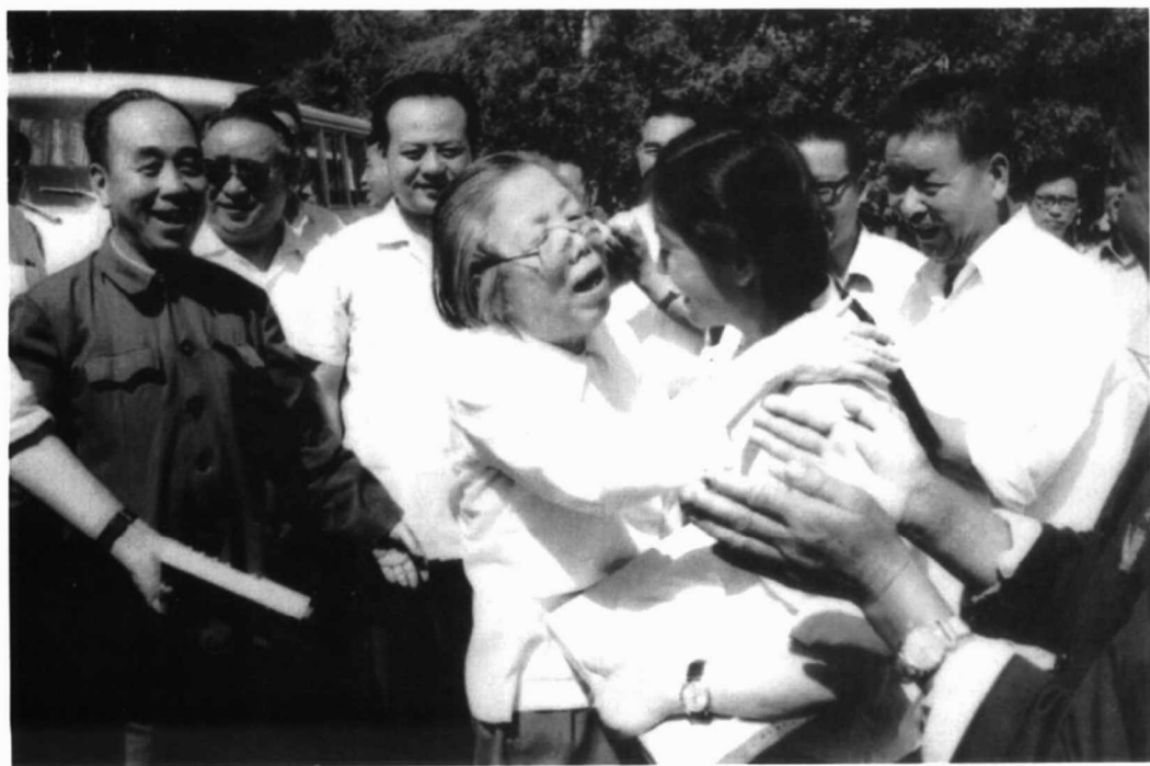
1981年6月23日，邓颖超到石河子视察，图为在周总理纪念馆前与上海支青拥抱。前排左起：刘炳正、邓颖超、杨永青、侯正元。