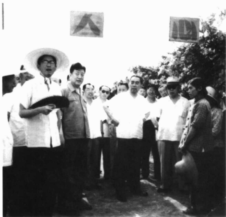
1965年7月5日，周恩来总理视察上海支青点。前排左三周恩来，左四陈毅，左二张仲瀚。