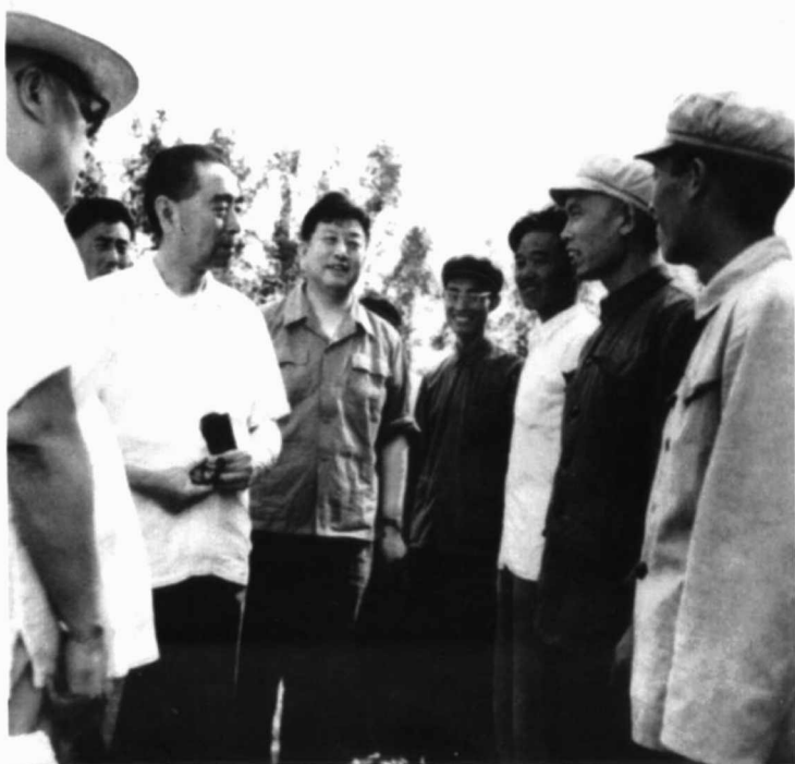
1965年7月5日，周恩来总理在支边青年连队接见上海支青。左一陈毅，左二周恩来，左三张仲瀚。