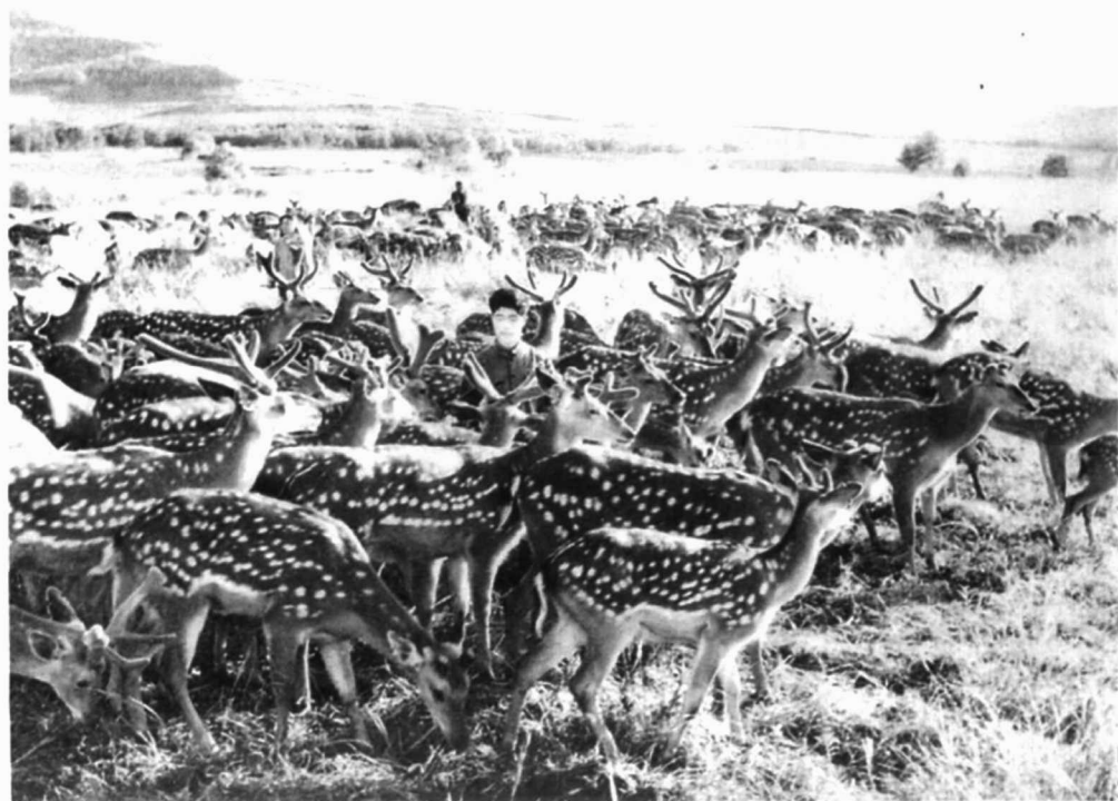
支边知识青年驯鹿场面。