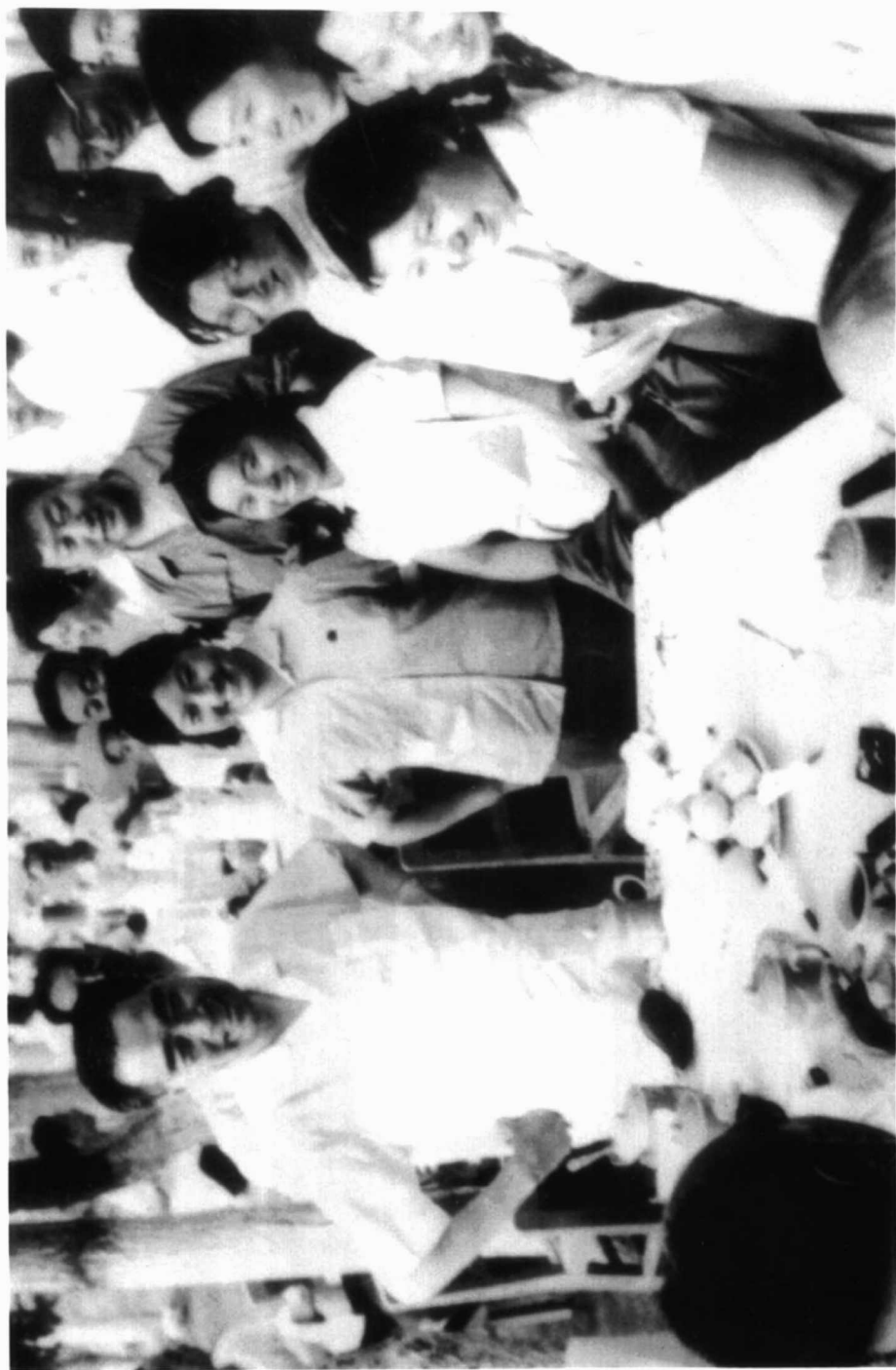
1965年7月5日，周恩来总理在石河子总场接见上海支边知识青年。从左至右：周恩来、杨永青、张仲瀚、雍凤兰、孙贵娟、郑月华、卓爱玲、魏淑奎。