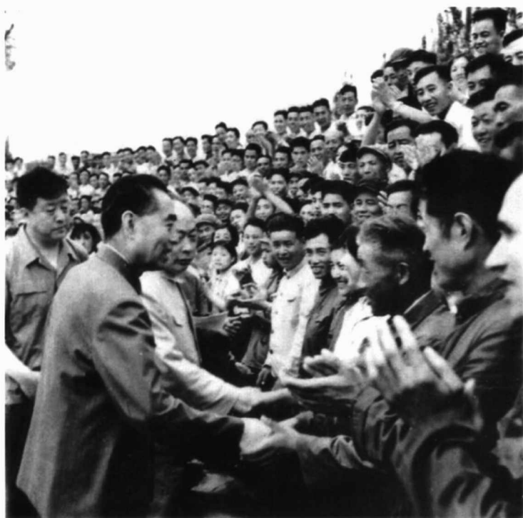
1965年7月6日，周恩来总理、陈毅副总理在石子宾馆接见老干部、劳模和支边知识青年代表。