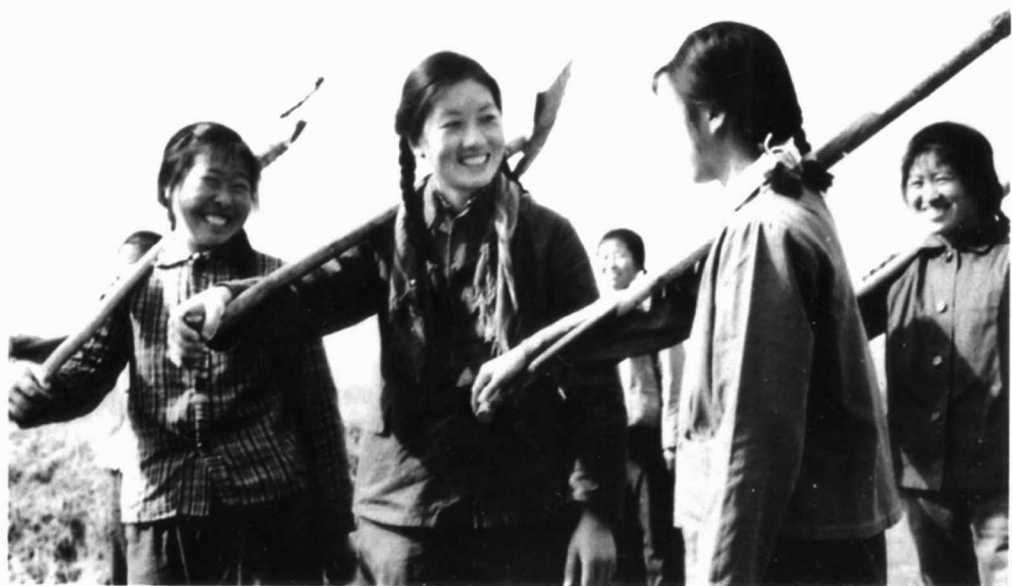
上海支青欢声笑语上工地。