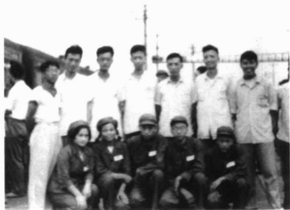
上图:1964年9月16日,上海行知中学教师及领导为进疆学生送行。