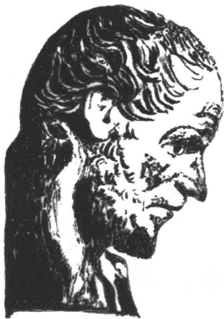
图 1.1 亚里士多德 (公元前 427—前 347)

有理念才是“绝对存在”，才是永恒不变的、真实的。他认为，物质世界是只有通过理性思想才能认识到的理念决定的，前者是后者的摹本。张三是人，李四也是人，可是，张三不是李四，也不同于王五。任何具体人之间都有差别，但有一点是不变的，他们都是人。“人”就是一个理念。理念是一类事物的共同的本质属性的总和，它同概念有相通之处，但不等于是概念。因为，在柏拉图看来，理念不是在头脑中产生的一个个观念，而是处于具体事物之外的另一类实在，在物质世界之外另有一个理念世界。两者不仅并存，而且后者决定前者。他认为，理念是原本，是模型，一个个具体事物是一个个相应的理念的影子和摹本。这种观点是整个柏拉图哲学的基石和支撑点。但恰恰在这个基石和支撑点上首先受到了他的学生——亚里士多德的批