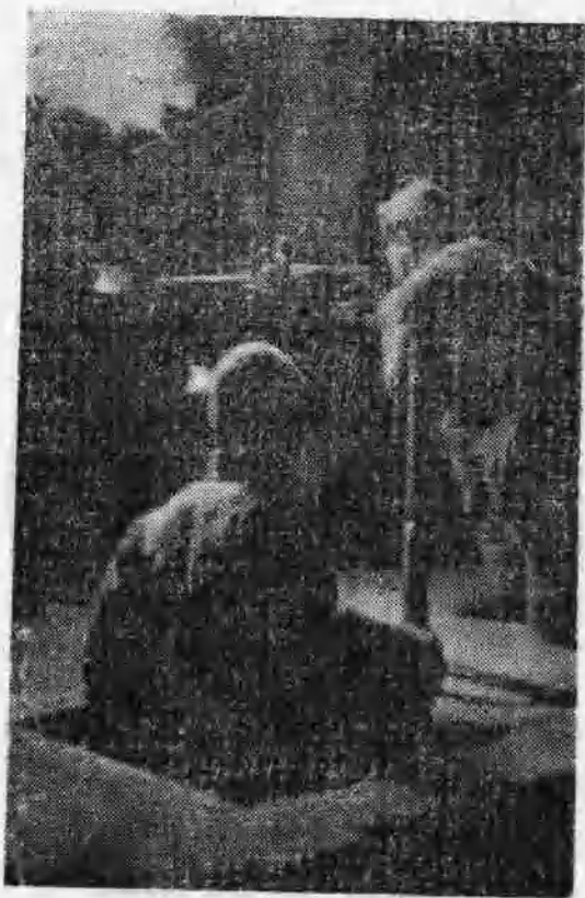
图12 1944年，在冀中某地的一次战斗中，八路军从另一个地道口出来，到室内利用预设的射击孔袭击敌人。