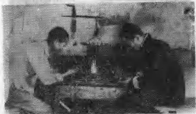
图7 1940年敌人清剿，冀中某地工人在地道里制造手枪。