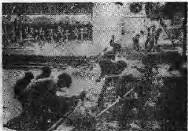
图5 抗日战争时期，冀中某地妇女参加挖地道。