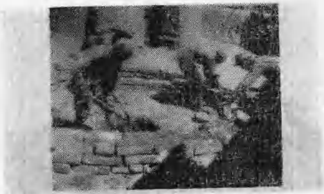
图3 1942年4月，八路军在定县（今定州市） 马阜才村击溃了上千人敌的进攻。这是八 路军在地道口修工事。准备迎击敌人。