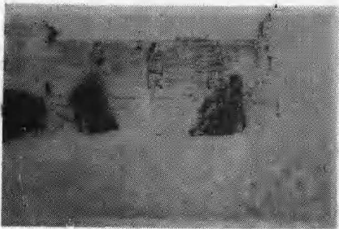
图2 在冀中某地地道战中，八路军和民兵沉着冷静地迎击敌人。