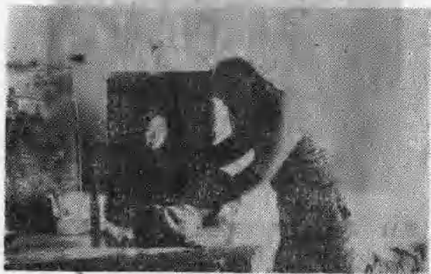
图10 哦！原来在年画后面（1943年冀中某村）。