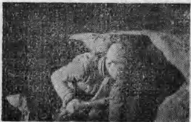
图4 这是1944年八路军和民兵在冀中某地的战斗中， 从地面转入地道的情形。