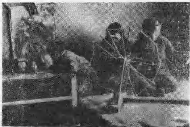
图9 地道口在哪儿？（1943年冀中某村）