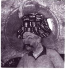
約1620年由蒙兀兒學派所繪之阿拔斯一世像

vin)遷至伊斯法罕(Isfahan)。伊斯法罕很快成爲世界上最美的城市之一。他修建許多寺院、旅店、公共浴場、