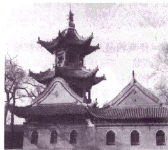
阿城清鎮寺望月樓

中國黑龍江省南部縣。位於阿什河畔，西北距哈爾濱20多公里，為哈爾濱市的衛星城市。原名阿什河城(1909)。清光緒34年(1908)設縣。農林產品豐富，為哈爾濱市重要的食品供應基地。農產有大豆、玉蜀黍、小麥、亞麻、甜菜、大蒜等。1909年起有波蘭等國外資在此建立甜菜製糖廠，現仍為本縣重要經濟部門，還建有啤酒和亞麻加工廠等。新建工廠還有製磚、機電設備廠、農機等。很多工業都和哈爾濱有密切關係。濱綏鐵路通過本縣，公路、水運也較便利。縣城南白城是金(1115~1234)故都上京會寧府舊址。玉泉鎮為著名風景區。人口567,000(1982)。