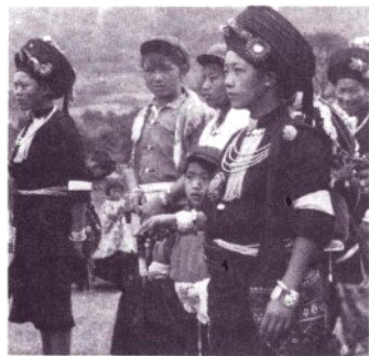
阿昌族婦女民族服飾

中國少數民族。分布在雲南西南隴川、梁河和鄰近的潞西、龍陵等縣。人口約2萬(1982)。語言屬漢藏語系藏緬語族，多兼通漢語和傣語。阿昌族最初分布在金