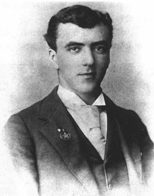
司徒雷登 17岁时摄于美国弗吉尼亚州西德尼学院。

1911年辛亥革命爆发，金陵神学院暂时停办。司徒雷登转而担任美国合众社驻南京特约记者。他利用记者的身份经常