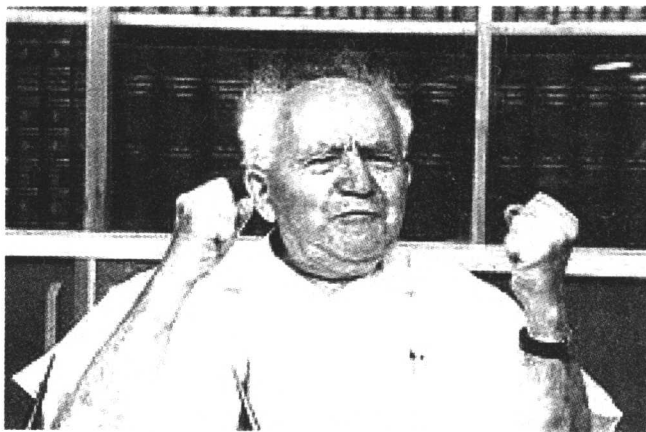
(以色列) 本-古里安 以色列的建国者