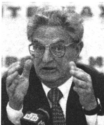
(美) 乔治·索罗斯 世界头号“金融大鳄”， 拥有实力雄厚的量子基金。