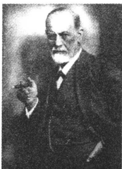
(奥地利) 弗洛伊德 神经分析学派创始人