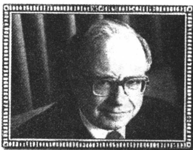
(美) 保罗·艾伦 微软公司的创始人之一