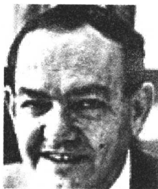
(美) 赫伯特·西蒙 1978 年度诺贝尔 经济学奖的得主