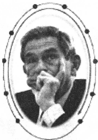
(美) 保罗·沃尔福威茨 现任世界银行行长