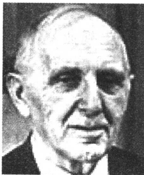
(美) 西蒙·库兹涅茨 1971 年度诺贝尔经济学奖 的得主