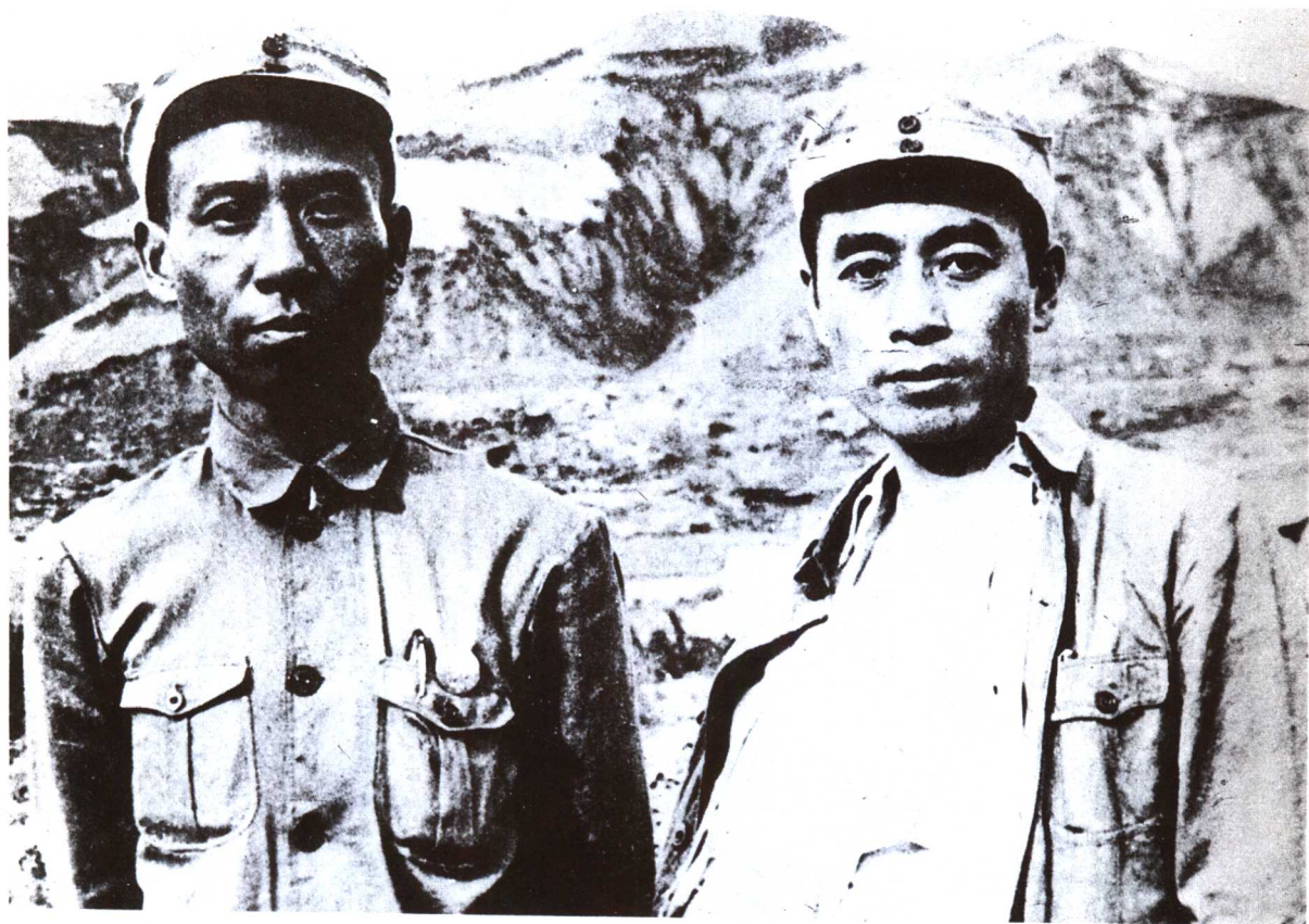
刘少奇、周恩来在延安（1939年7月）