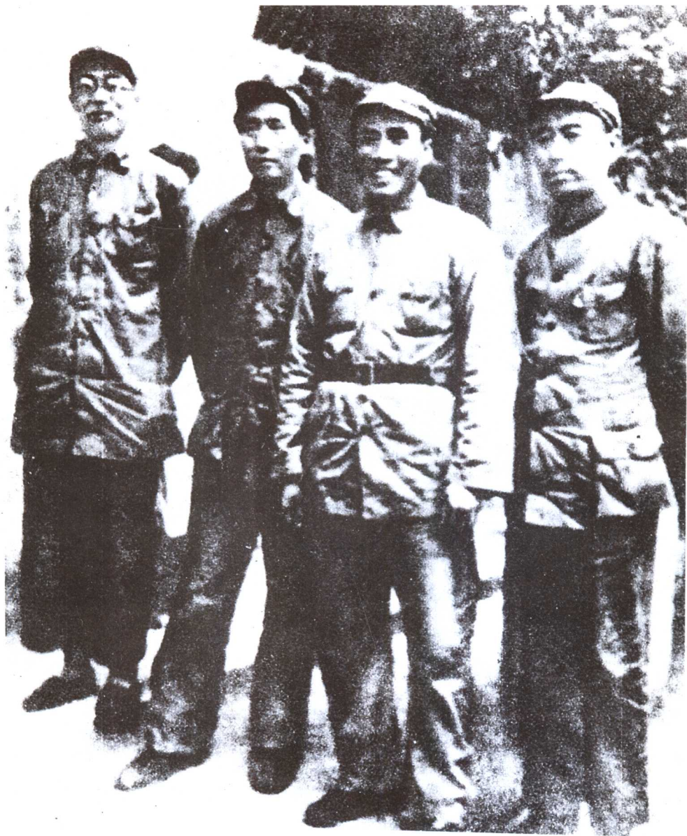
毛泽东同志与周恩来、朱德、林伯渠(边区政府主席)在延安 (1937年1月于凤凰山)