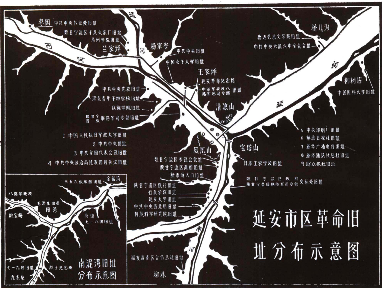
延安市区革命旧址分布示意图