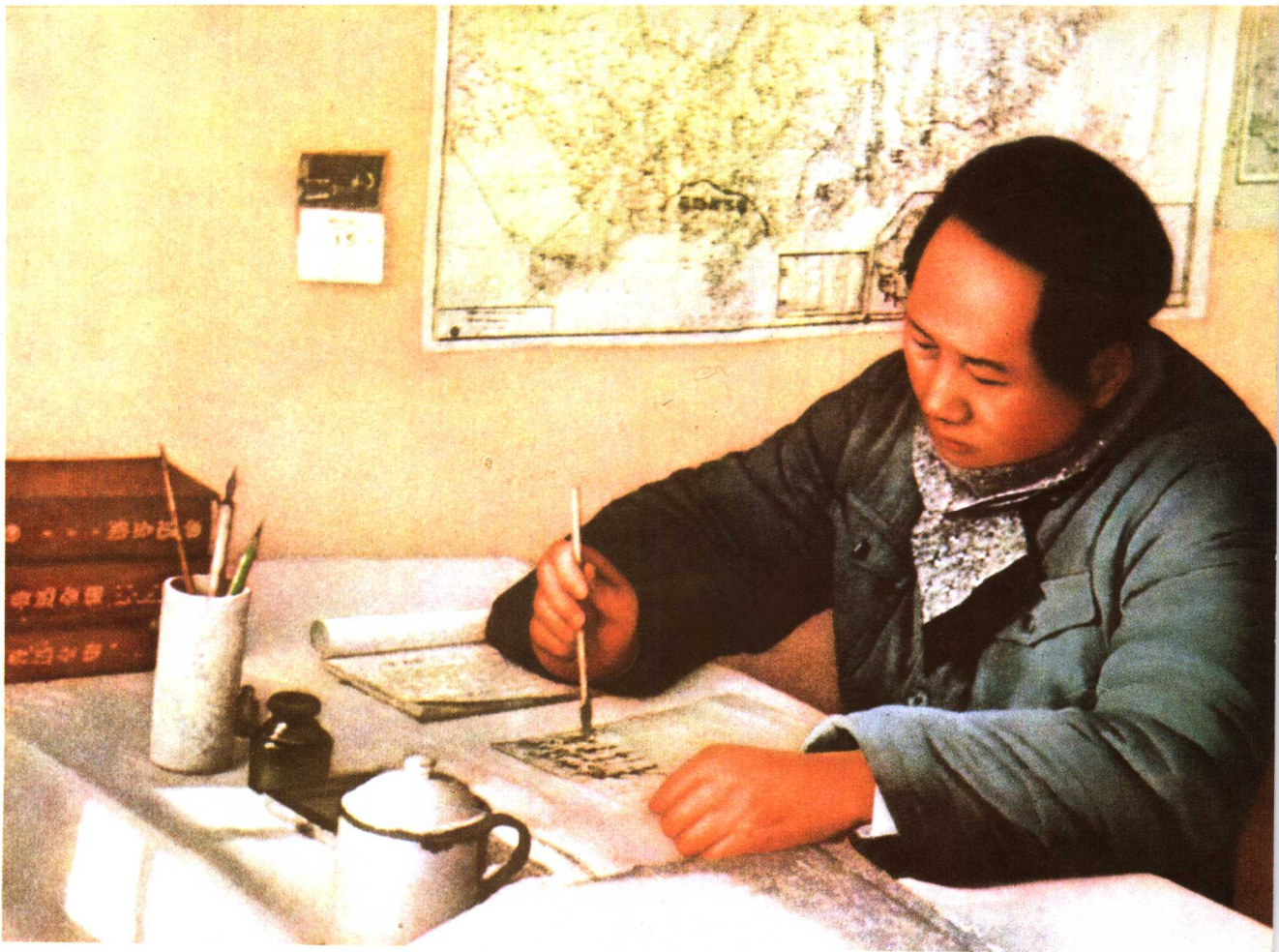
毛主席在延安枣园窑洞中工作（1946年）