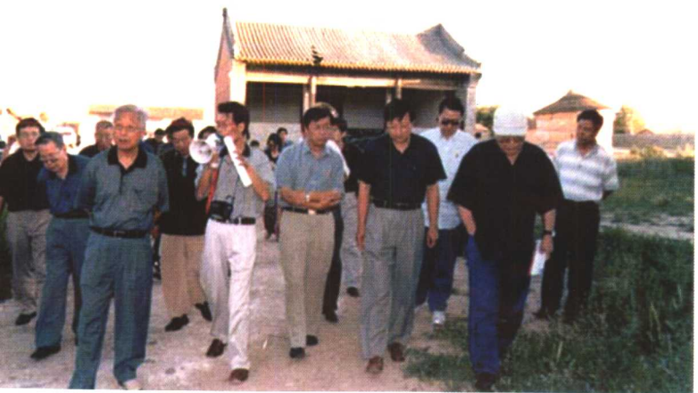
全国政协副主席张思 卿一行考察汇宗寺维 修情况。