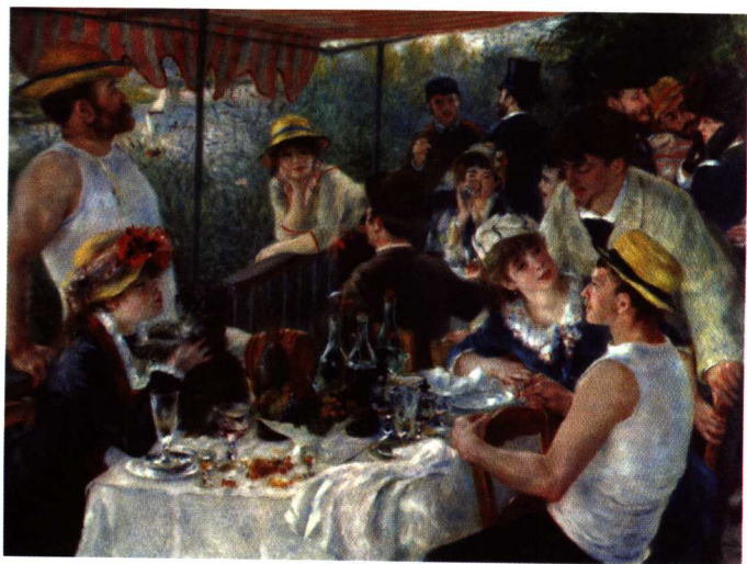
皮埃尔-奥古斯特·雷诺阿 《游艇上的午餐》 1881年 华盛顿菲利普斯收藏