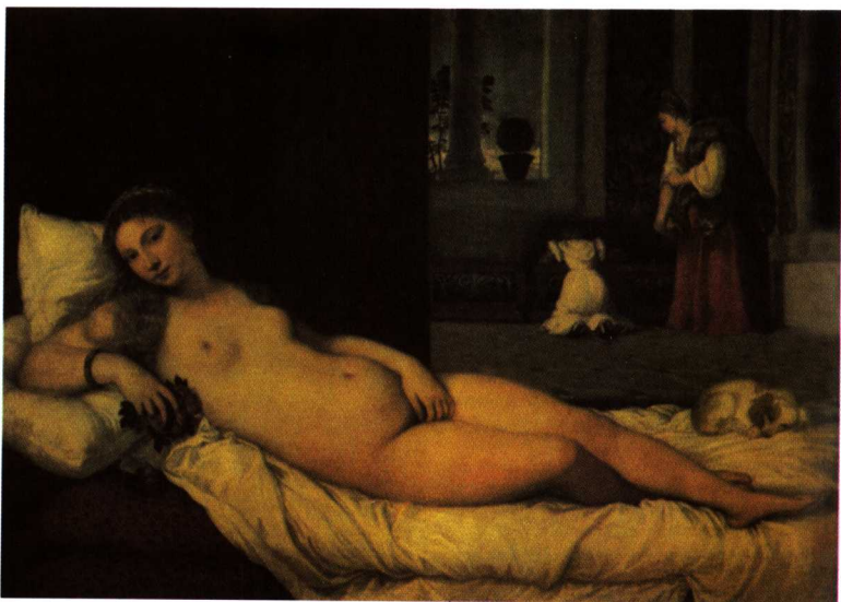
提香 《乌比诺的维纳斯》 1538年

粗俗、猥亵、性感，使我们意识到马奈实际上是一位贵族。我们还了解到，19世纪60年代的大众很可能不了解，此画的人物造型选自提香的《乌比诺的维纳斯》(Venus of Urbino)，马奈在前九年就临摹了这幅画。现在，对裸体人像的处理来说，它似乎已成为细腻和精致的一种典型。但是，它当时看起来是平面的、不完整的画面(“如同黑桃皇后出浴”，库尔贝这样比喻)。我们喜爱这只猫，发现它非常真实地具有猫科的习性，知道猫在马奈的朋友波德莱尔的诗歌里的象征作用。事实上，我们发觉这整幅画面在它的直率上，在对豪华和纵情的暗示上，并且在裸女白皙的肉体、白色的床单和五颜六色的静物花束与黑人女仆黑色的面孔和双手形成的鲜明对比上，都强烈地波德莱尔化了。我们来欣赏一下作品中裸体姑娘直视我们的不受约束的眼神，就好像在说：“我就在这儿，你们打算怎么办？”19世纪60年代的人们感觉到画中的裸体姑娘就是这