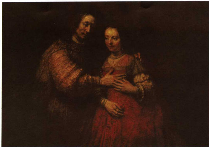
伦勃朗 《犹太新娘》 1668年

了解的东西,方法是把力量和简洁、说服力和理解力融为一体,这些特点的结合激发了人们对艺术的共同信赖感。这种信赖的近例是奥登的一首诗的第一行:“对于痛苦,他们决不会搞错,古代大师们。”尽管不是完全真实——一些古代大师平庸而做作,还有一些大师显然对痛苦抱一种不明确的态度——但是这句诗确实揭示了艺术是帮助我们生活的一种方式。