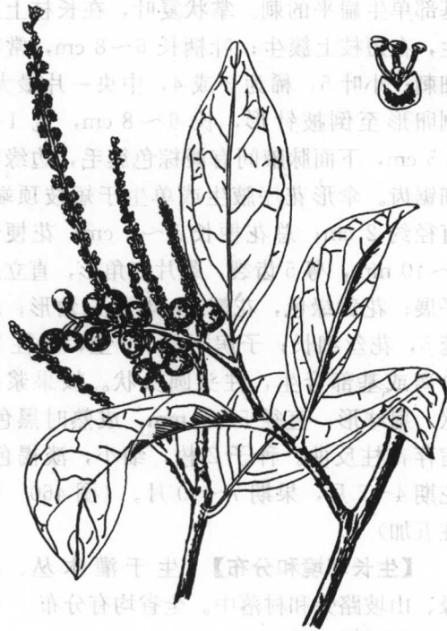
图 459 五月茶

【药材鉴别】性状鉴别：叶矩圆形至倒披针状矩圆形，长 6~16 cm，宽 2~6 cm，革质，淡棕绿色，两面无毛，有光泽；侧脉 7~11 对。气微，味涩。核果近球形，深红色，干后呈棕红色或紫红色，长 5~6 mm，直径约