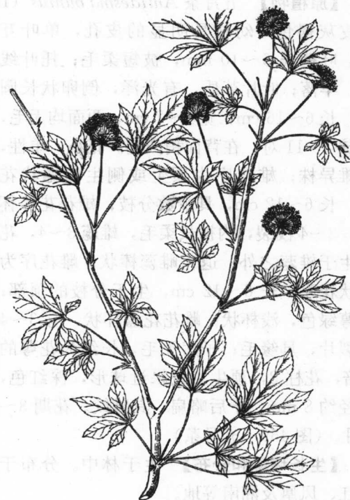
图 460 细柱五加