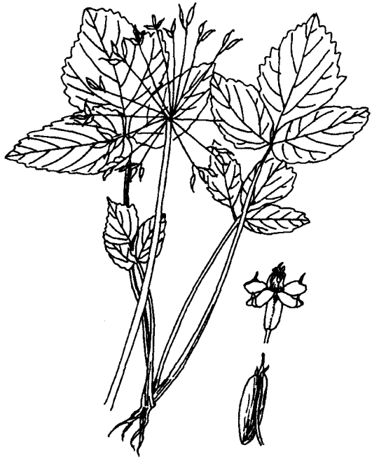
图 457 五匹青

【原植物】 五匹青 Pternopetalum vulgare (Dunn) Hand. - Mazz. : 多年生草本。高30~50 cm。根茎有节，粗糙，细圆锥形，肉质。茎单生，或2~3，管状，中空，疏生短毛。基生叶叶柄长10~20 cm，基部有宽膜质叶鞘；叶片轮廓三角状卵形，长6~7.5 cm，一至二回三出分裂，裂片纸质，卵形或长卵形，长2~5.5 cm，宽2~5 cm，常2~3裂，沿叶脉和叶缘有粗伏毛；茎生叶与基生叶同形。伞形花序；无总苞片；伞辐15~30，近丝状，长2~5 cm；小总苞片1~4，线状披针形；小伞形花序有花2~5；萼齿大小不等；花瓣白色至淡紫色，长圆形至倒卵形；花柱基圆锥形，花柱直立。双悬果长卵形，基部宽而圆钝，长3~5 mm，宽2~3 mm，果棱有丝状细齿，每棱槽内有油管1~3个。花果期4~7月。(图457 五匹青)