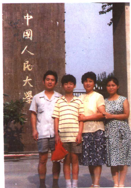
▼ 1988年作者全家在北京中国人民大学