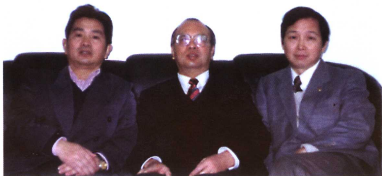
1997年国家版权局副局长沈仁干、版权司长王化鹏和作者在上海