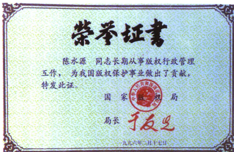
1996年中华人民共和国国家版权局局长于友先颁发的荣誉证书