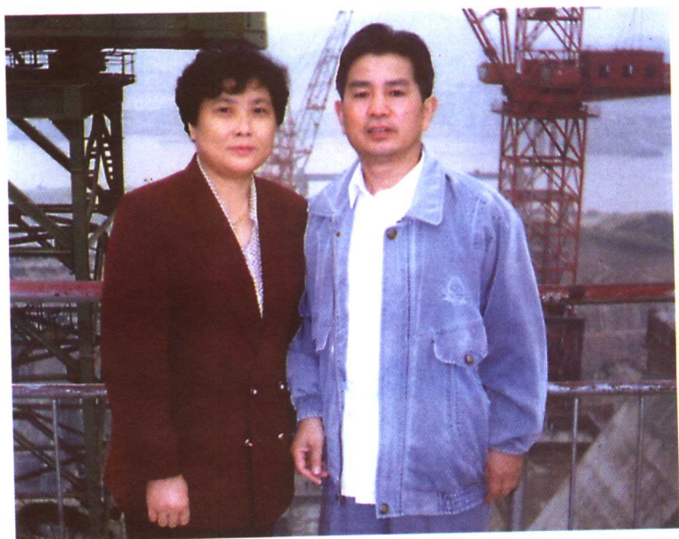
1997年作者和夫人在三峡工地