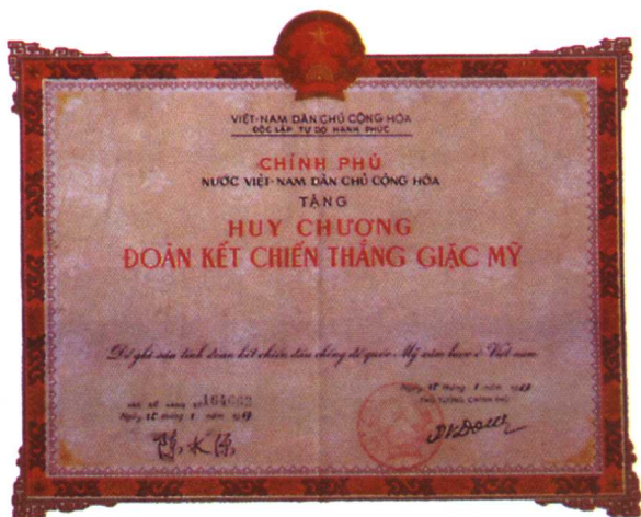
1969年越南政府颁发的援越抗美嘉奖令