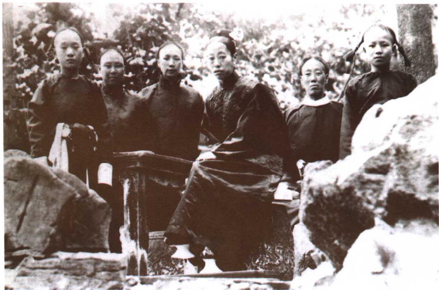
隆裕太后（光绪皇后）与太监

剧，其中以东汉、唐、明三代为最。秦朝的赵高，东汉的侯览、张让，唐代的高力士、仇士良、田令孜，明朝的王振、汪直、刘瑾、魏忠贤，以及清代末年的李莲英，都是历史上臭名昭著的宦官。