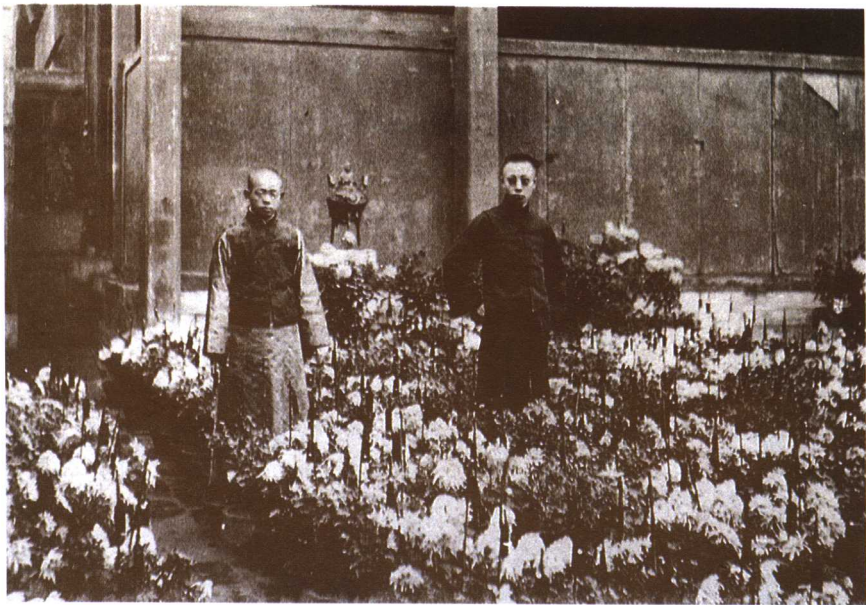
溥仪与太监在养心殿前