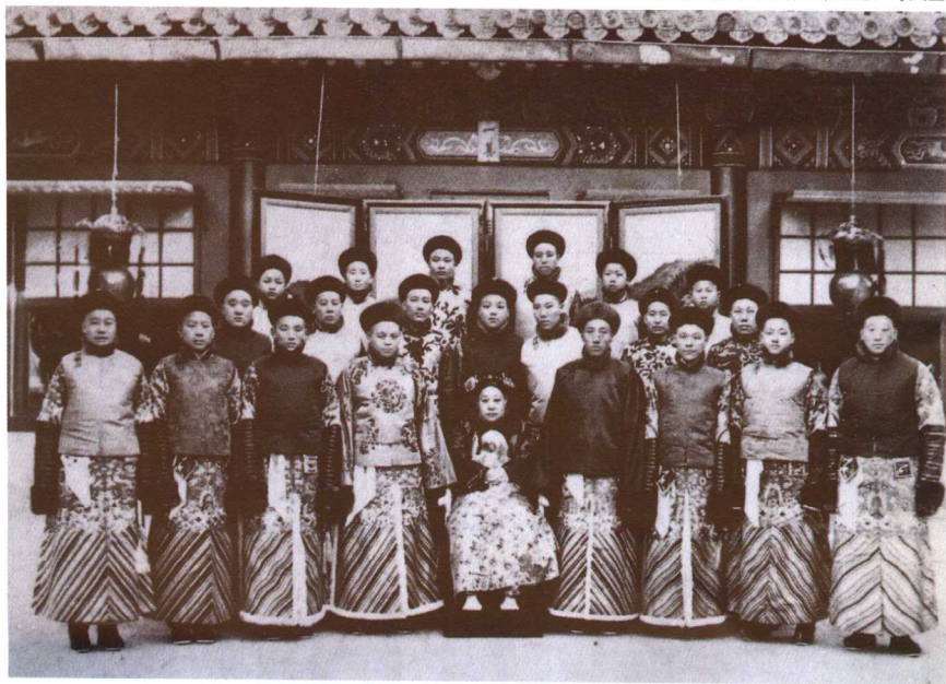
端康皇太后（光绪皇帝瑾妃）与太监

太监在内务府统辖下。宫内外使用太监地方和机构达七十多处。设在乾清门内西侧的“宫殿监办事处”即敬事房，是具体管理太监的总机构。内设宫殿监正副总管九名，为太监总首领，下设各殿、各宫及各部门的首领太监，分别统领为数众多的一般