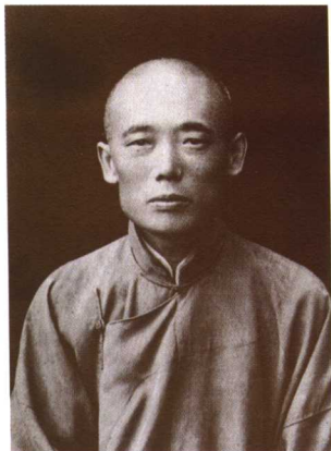
内殿总管太监邵兴禄