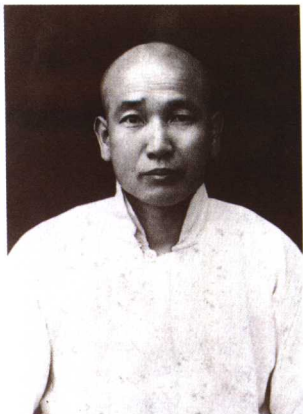
内殿总管太监延寿