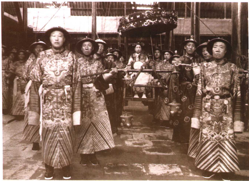
慈禧在颐和园仁寿殿前乘舆照，前为总管太监李连英，崔玉贵

依百顺、出身低下而又没有后代的内官最可靠。而宦官的上层则往往利用在宫廷中的这种特殊地位，攫取极大的权力，甚至操纵帝王。这些人数量不多，但奴性十足，狡黠阴险，残忍狠毒，一旦成为皇帝