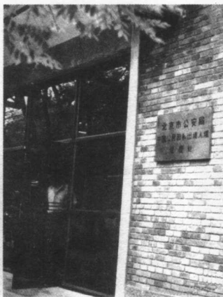
90年代初，“中国公民因私出境入境管理处”已扩建成为装修一新的服务大厅了。