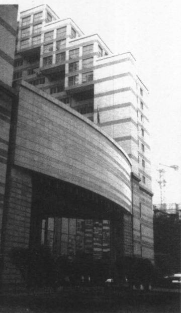
90年代末，“中国公民因私出境入境管理处”已变成了西二环路边高高矗立的一栋现代化办公大楼。