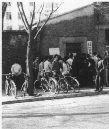
80年代的“国门”——北京东交民巷的“中国公民因私出境入境管理处”。门前是渴望出国留学而一大早起去办护照的年轻人。