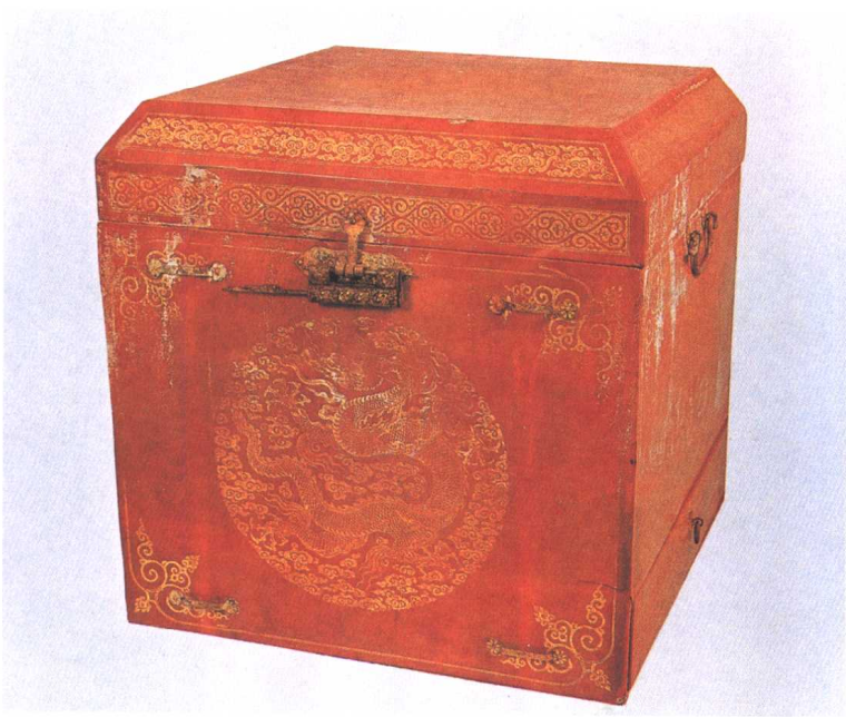
明·餓金云龙纹朱漆盃顶箱