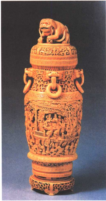
清·牙雕红楼梦人物瓶