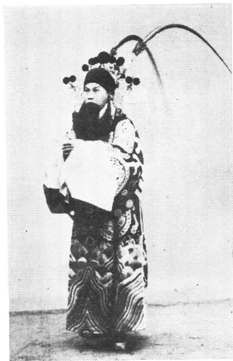
高庆奎在《四郎探母》中 饰杨延辉