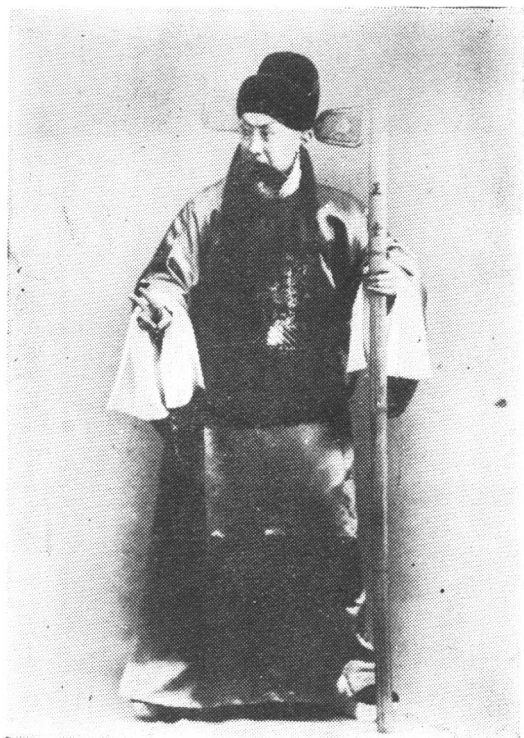
马连良在《串龙珠》中 饰徐达