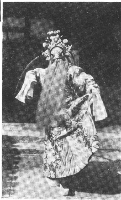
侯喜瑞在《连环套》中 饰窦尔墩