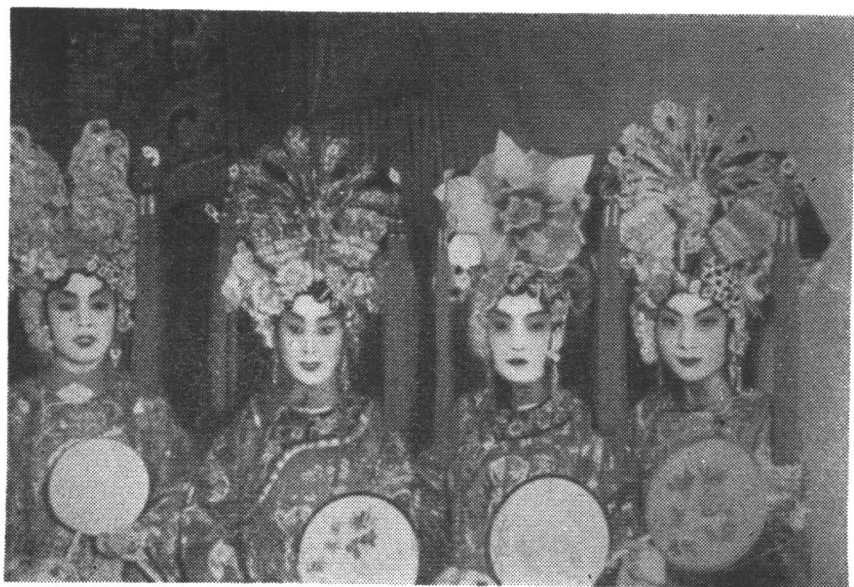
旗装大会(《畅春园》剧照)