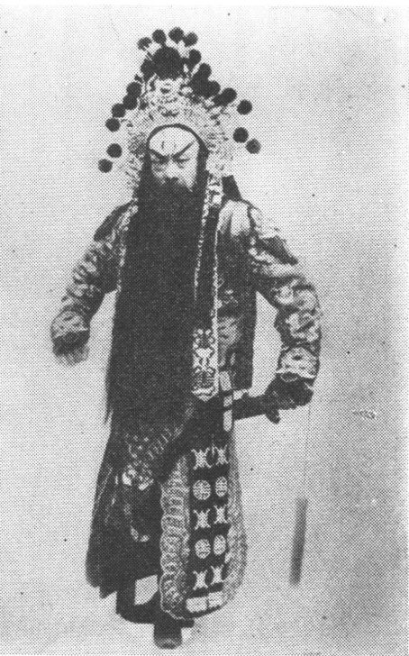
杨小楼在《灞桥挑袍》中饰关羽