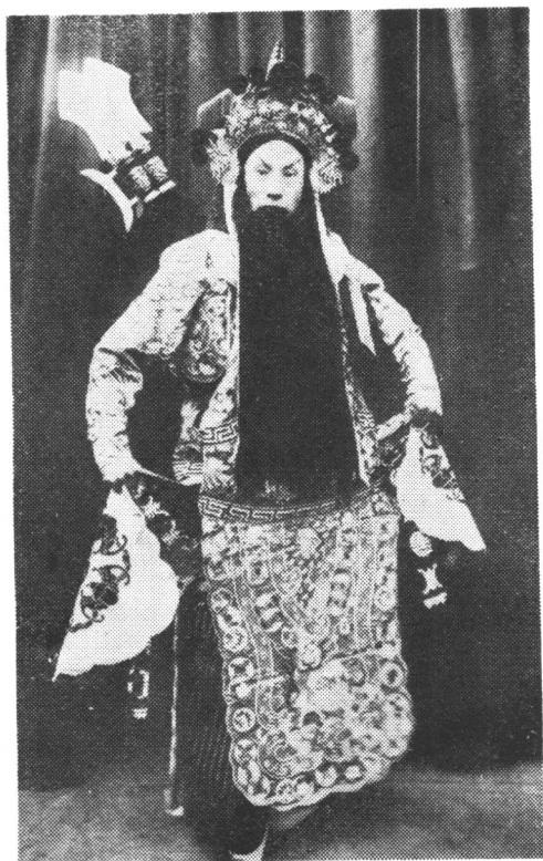
杨小楼在《甘宁百骑劫魏营》 中饰甘宁