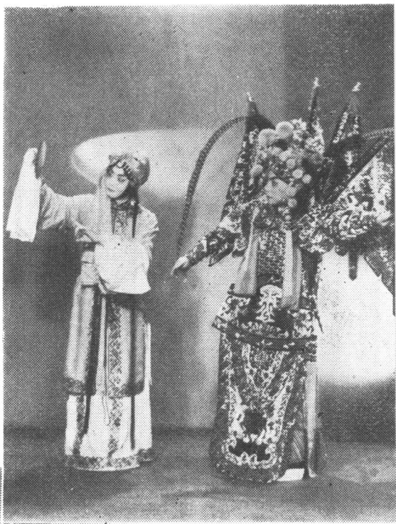
程砚秋、俞振飞在《平贵别窑》 中饰王宝钏、薛平贵