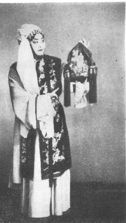
程砚秋在《锁麟囊》中饰薛湘灵