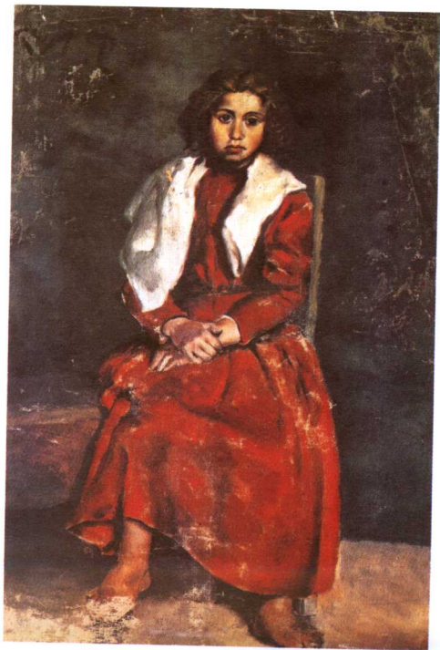
布上油画 81 × 60cm 私人藏

这幅画是毕加索 14 岁时的油画代表作。幼年的毕加索就对绘画表现出浓厚的兴趣，那些稚拙而奇妙的构图、协调均匀的色彩显示了他的天赋。这幅画就是其中之一。画面描绘了一个坐在椅子上、肩披围巾、身着红裙的女孩形象。笔触清新稳健，动态和神情的把握很到位。毕加索 1895 年就是凭此画免试进入艺术学校高级班的。