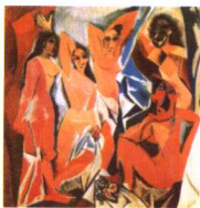
第一影响力艺术宝库