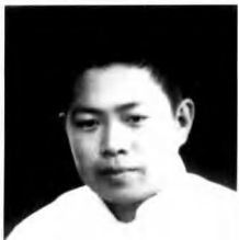
王世襄小影 摄于1931年