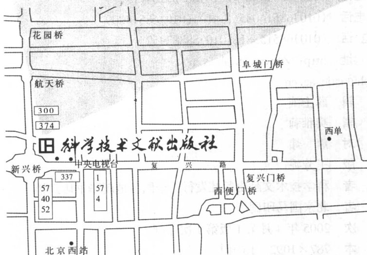
科学技术文献出版社方位示意图