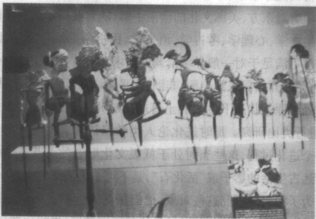
太平洋诸岛的原始居民祭祀礼仪和娱乐时用来表演皮影戏的傀儡。

褒贬地记录下来作为“文化志”(Ethnography)以供后来者研究。这种悬切的态度是导致后来博厄斯“文化相对论学派”(Cultural Relativism)的理论基础。