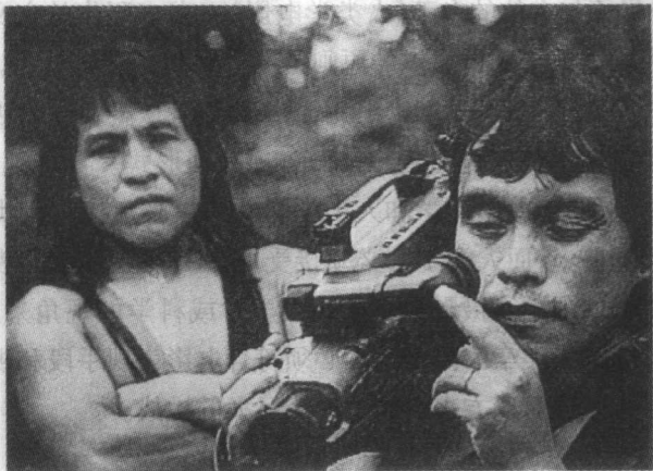
当代原始部落中,原住民被训练使用摄影机来表达他们认知世界的观念。

绍人类学的一种教育手段。最早可溯的经典人类学电影是罗伯特·弗莱尔蒂的《北方的拿挪克人》。近年来电视录像技术的发展大大减少了拍片成本,给这个领域的发展带来了新的刺激和冲动。但是直到最近的“视觉人类学”兴起和应用电视的便利才使人类学家们系统地审视作为研究和教育的媒介的电影的一些局限。当代人类学电影制作中最有意义的一个发展是人类学家训练当地文化持有者自己使用摄影器械,这样能使他们通过自己的文化概念模式去解释他们的世界。” ⑥ 这一词条竟没能介绍一些最基本的理论概念和学术内容,甚至对人类学电影的文化意义、摄影学意义和美学内容未置一喙而简括到了令人遗憾的程度。略给人以启发的是它引出了“视觉人类学”的概念。