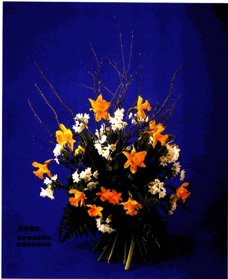
金玉满堂 花卉：黄馨、紫罗兰、 红掌、金边吊兰、 红掌、金边吊兰