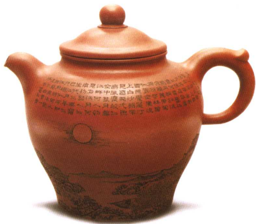
现代谭泉海刻紫砂古韵壶