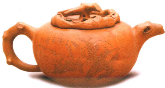
现代任淦庭刻紫 砂翻盖大柿壶