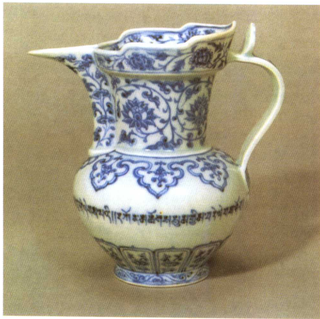
明永乐青花缠枝纹僧帽壶