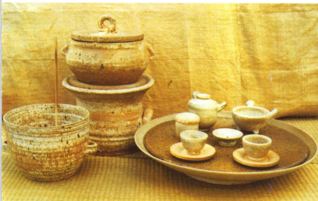
现代韩国金京锡在中国制作的组合茶具