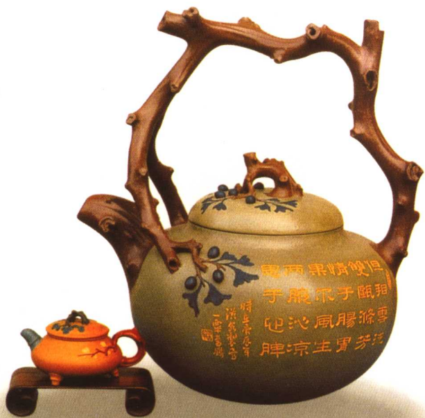
现代范洪泉制紫砂佳茗东坡壶