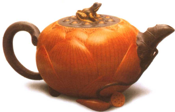
现代蒋蓉制紫砂 青蛙荷花壶