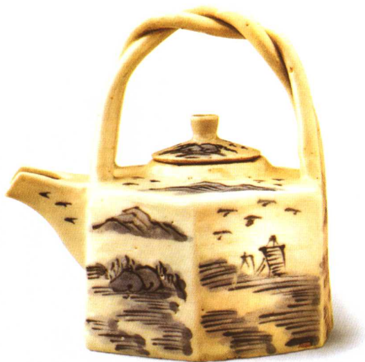
清代青花六角提梁壶