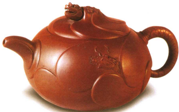
清代邵大亨制紫 砂鱼化龙壶