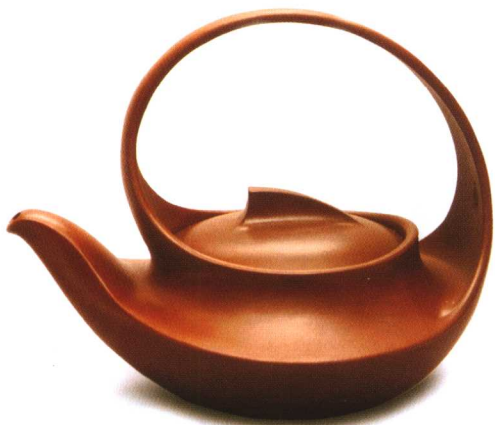
现代汪寅仙制紫砂曲壶