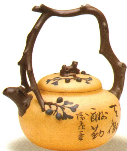
现代范颖制紫砂佳色东坡壶