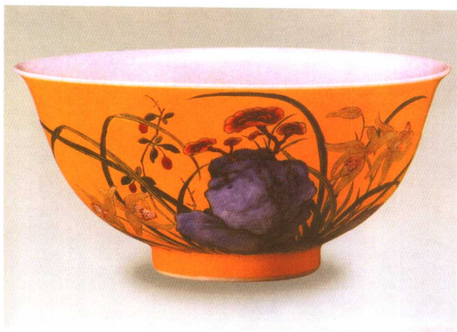
清雅正黄地珐琅彩芝兰寿石图杯