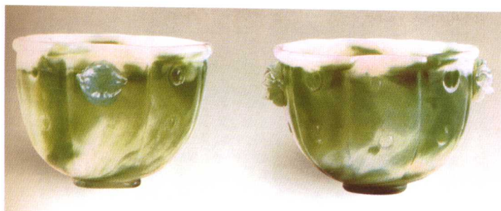
清代仿翠玉玻璃杯