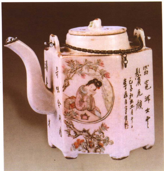
清光绪浅绛彩李鼎臣 绘松下品茶图提梁壶