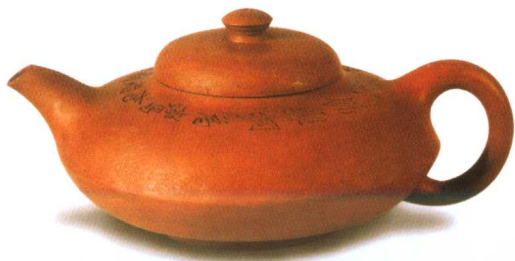
唐云收藏的曼生合欢壶