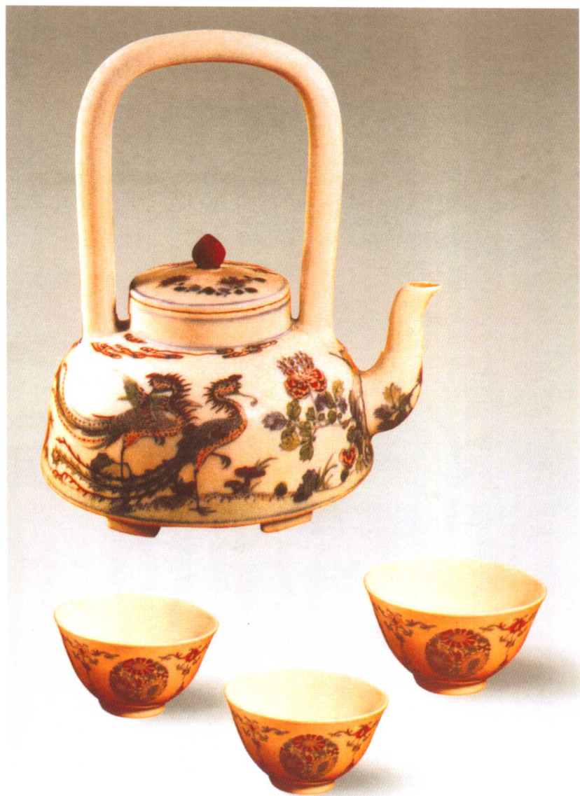
清雍正斗彩五伦图提梁壶及茶碗