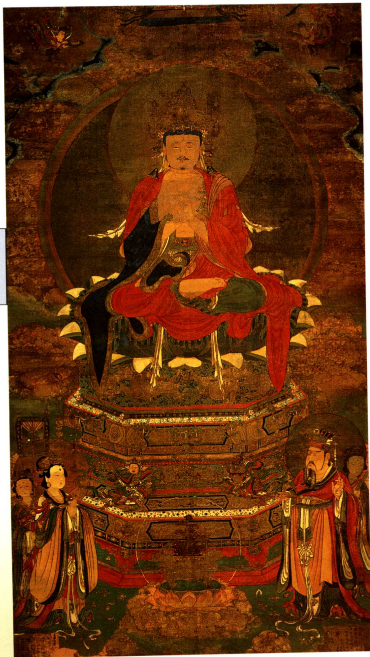
1. 毗卢遮那佛 像·明 Vairocana Buddha, Ming dynasty