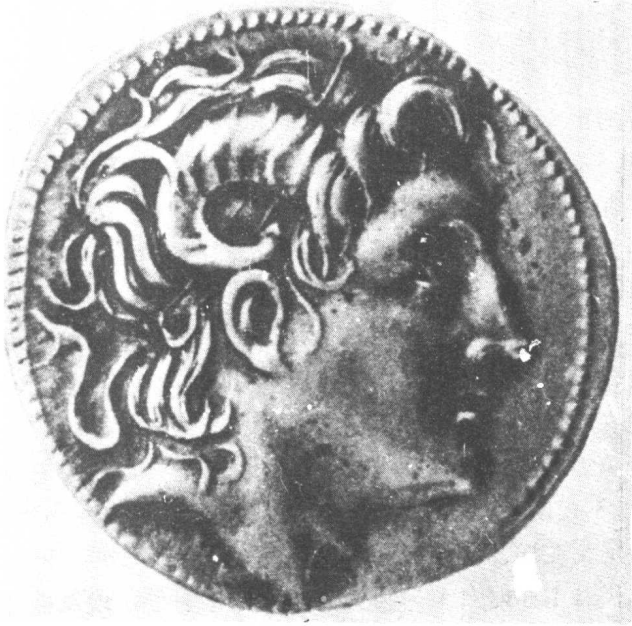
2 刻有亚历山大肖像的钱币。他头戴埃及双角王冠，约公元前三世纪。