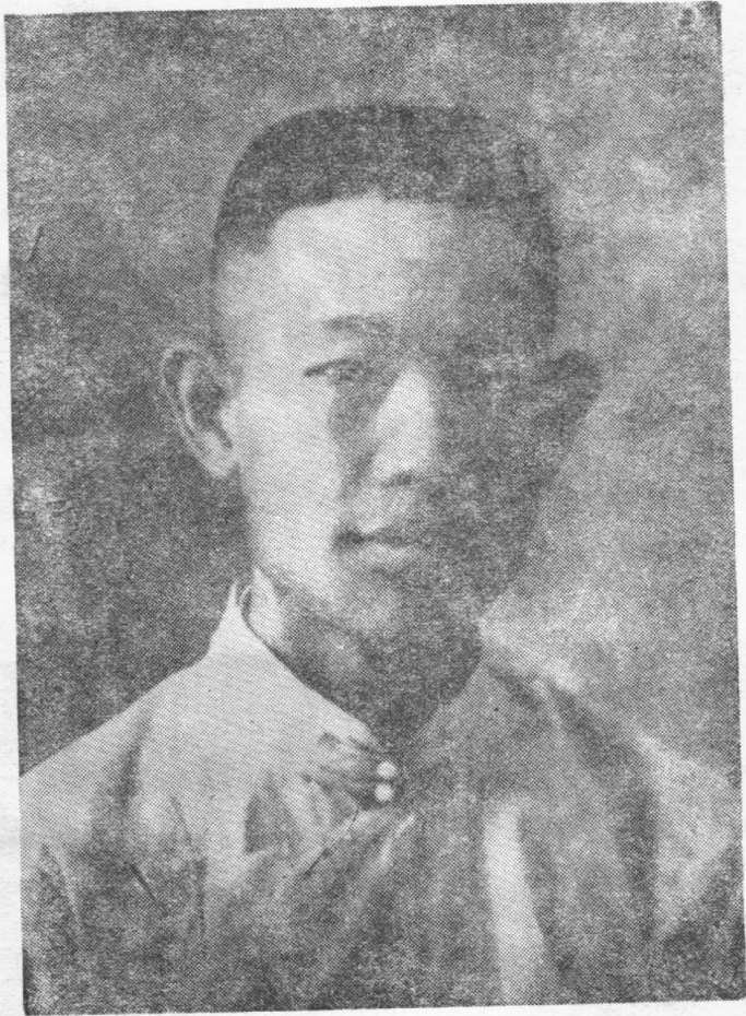
王 尽 美