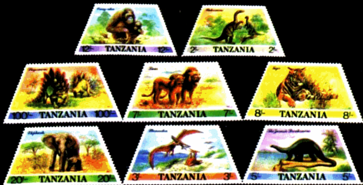
此组为坦桑尼亚发行的梯形动物邮票

美国发行的“史前动物”邮票(图6)分别展现了猛犸、剑齿虎、始祖马等的雄姿。猛犸大约生活在12000年前。因全身长着棕色长毛,所以又叫它毛象,大小与现代象差不多。上门齿特别长。在我国东北、内蒙、宁夏等地都发现过它的化石。剑齿,外形与现代虎差不多,但上齿发达,锐利如短剑,嘴巴能张很大,可捕食犀牛、大象等厚皮动物。始祖马大约生活在五千万年前,大小和狐差不多,是马类的祖先。