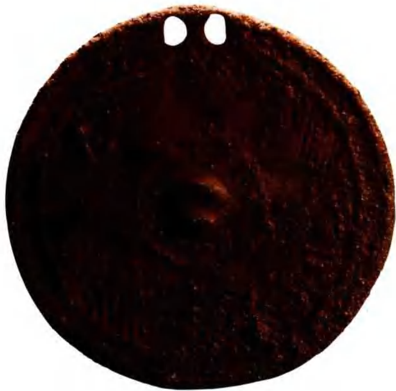
(图1) 七角星纹铜镜 直径8.9厘米