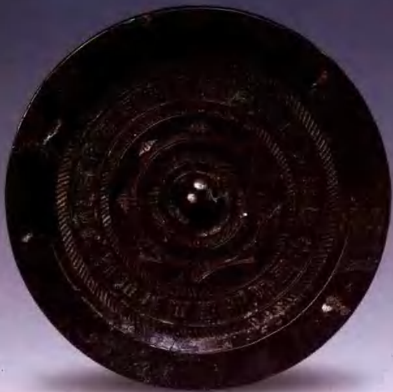
(图3) 西汉 昭明镜 直径11.2厘米 厚0.6厘米 重270克

圆形，圆钮，圆钮座。座外一周凸弦纹及一周内向八连弧纹带，其间各有简单的弧线装饰。其外两周短斜线纹带间夹一周铭文带“内而清而以昭明，光而象夫而日之月，而心忽而忠而不泄□”。宽平缘。漆黑色。