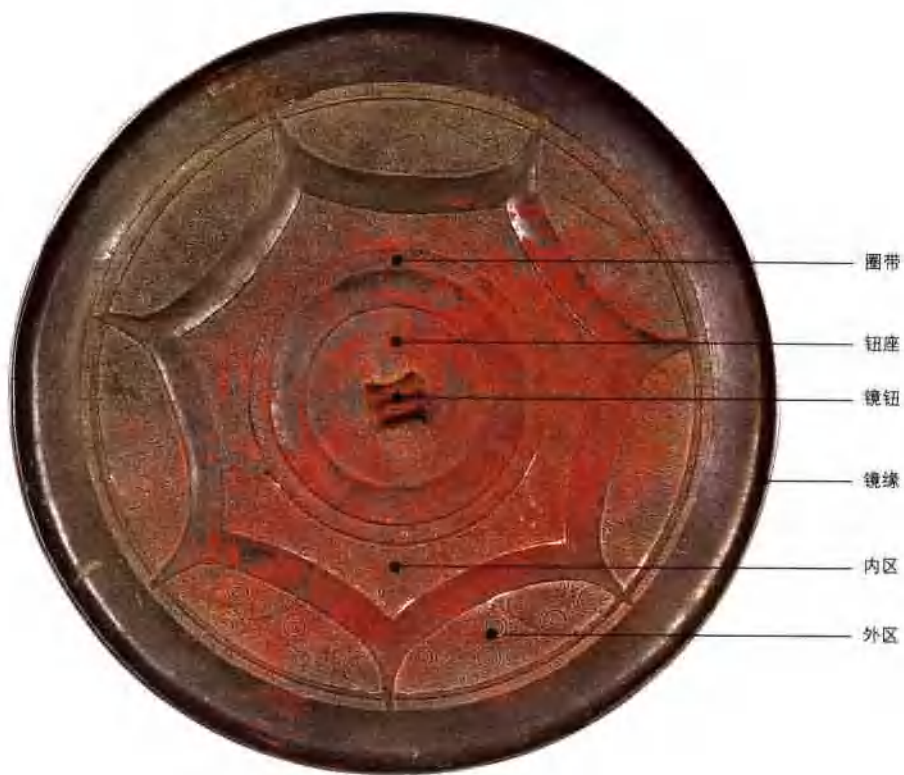
(图4) 战国 云雷纹地连弧纹镜 直径16.5厘米 厚0.6厘米 重280克