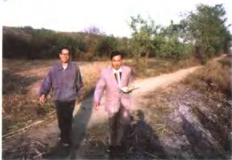
3. 本书作者(左)实地考察曹操墓田区