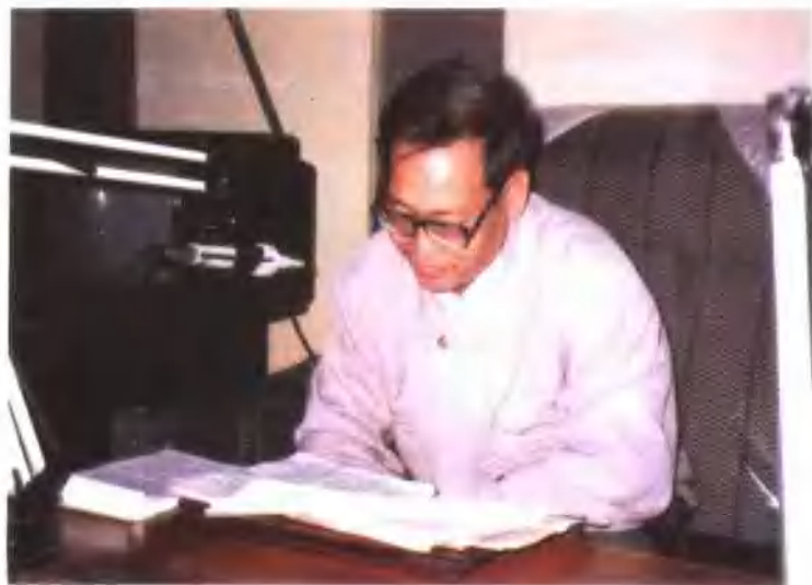
4. 本书作者在邯郸市广播电台直播室回答读者和听众关于曹操墓研究的提问