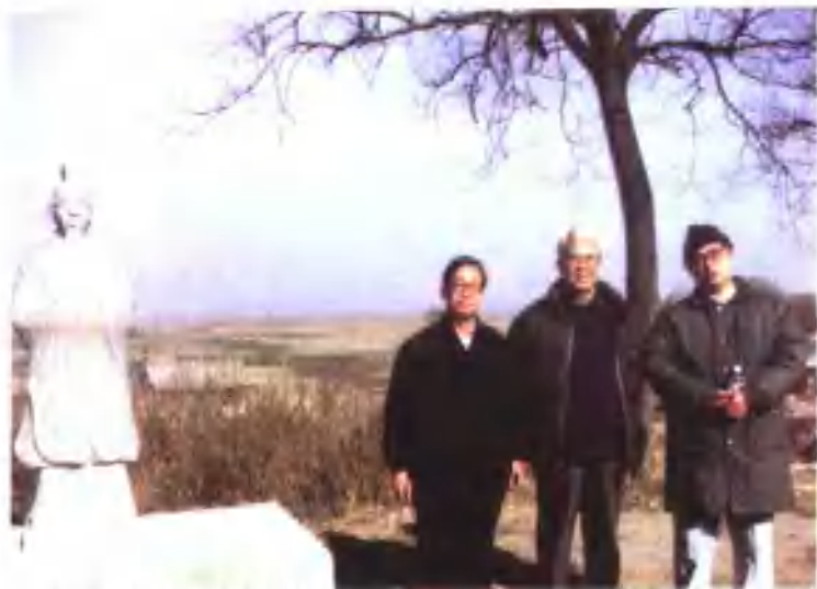
1. 本书作者（左）与全国政协常委、文史委员会副主任，中共中央党校原副校长龚育之教授（中）和全国政协委员，中国人民对外友好协会副会长陈夏苏（右）实地考察邳城铜雀台、金凤台遗址