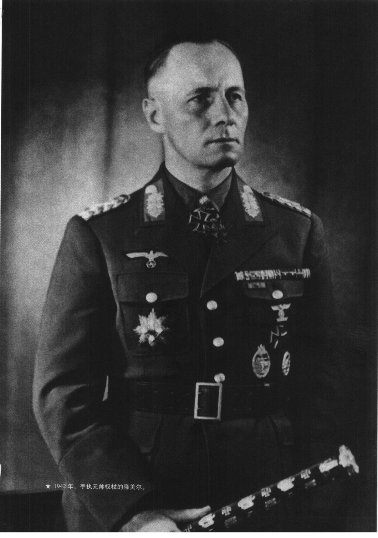
★ 1942年，手执元帅权杖的隆美尔。