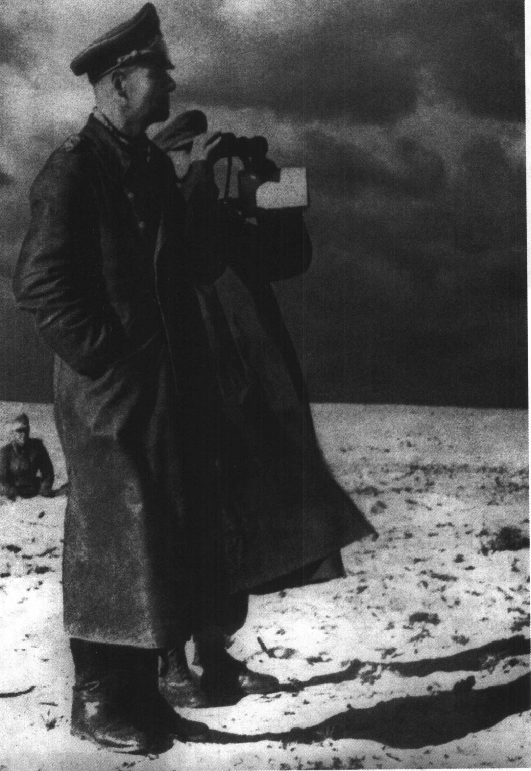
★ 德国入侵利比亚期间，隆美尔在非洲沙漠中视察。