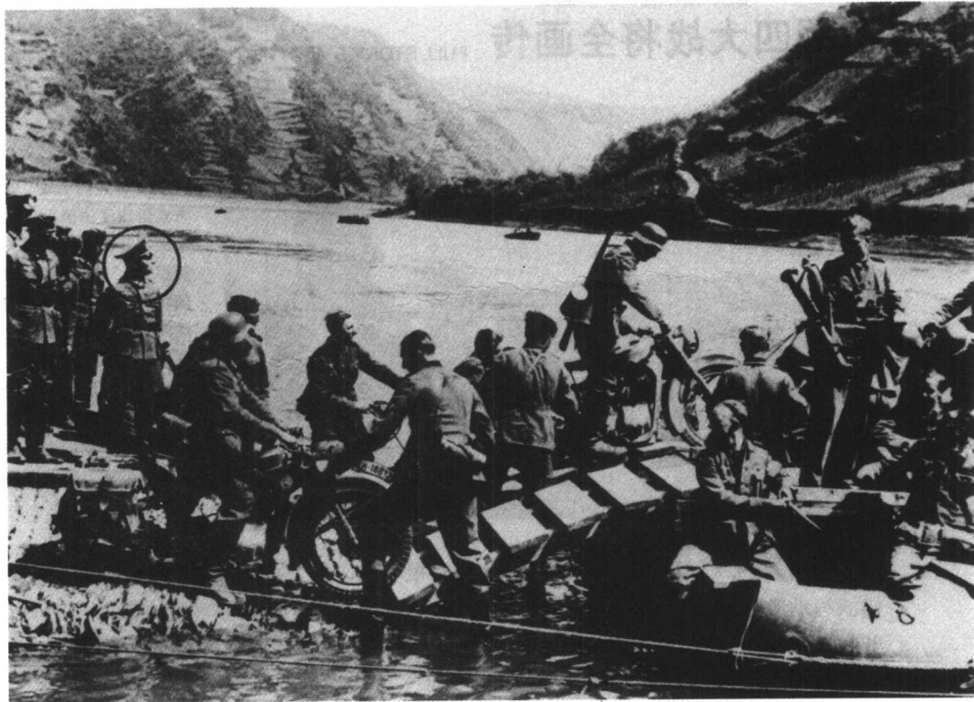
★ 隆美尔（图中画圈者）的摩托步兵正在渡过马斯河。

比利时的阿登地区，向圣康坦、阿布维尔和英吉利海峡沿岸总方向实施突击，割裂在法国北部和比利时境内的英法军队；“B”集团军群下辖第6和第18集团军共28个师，负责突破德、荷边境上的防线，占领荷兰全境和比利时北部，然后作为德军的右翼向法国推进；“C”集团军群下辖第1和第7集团军，共17个师，部署在马奇诺防线正面，其任务是进行佯动，牵制马奇诺防线上的法军。