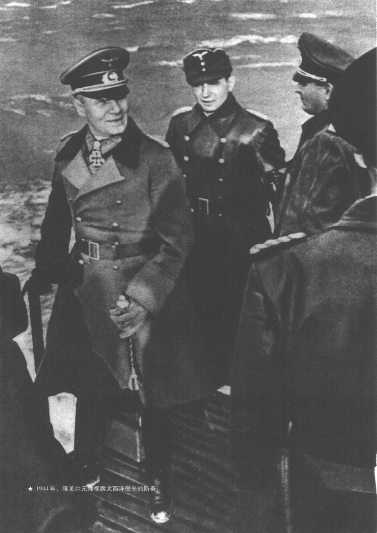
★ 1944年，隆美尔元帅视察大西洋壁垒的防务。