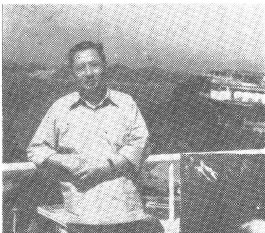
1980年5月 袁鹰在香港海滨公园