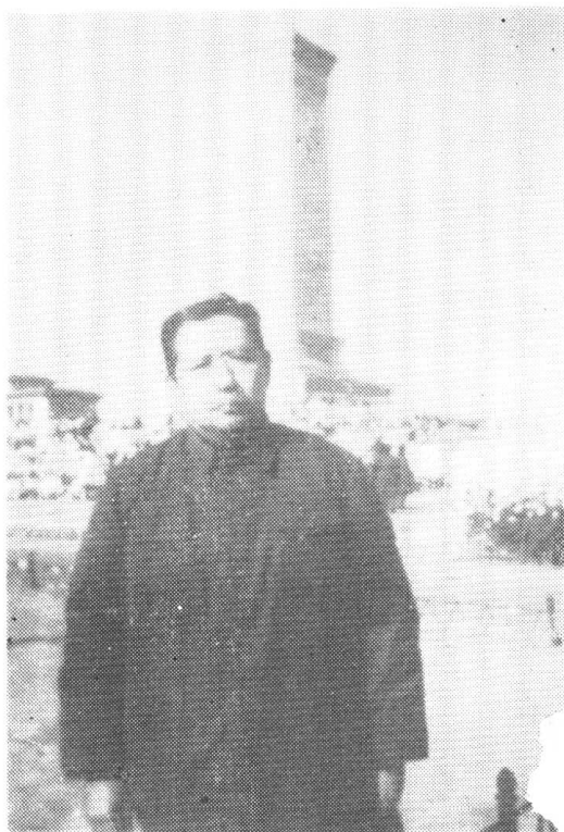
1976年1月袁鹰在天安门广场