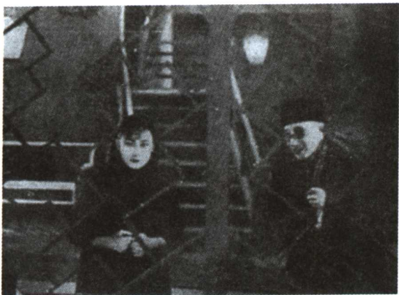
▲电影《歌女红牡丹》(1931年)是中国第一部蜡盘发音的有声电影。

贝。胡蝶在五年内还主演了《离婚》、《黄陆之恋》、《爸爸爱妈妈》、《桃花湖》、《碎琴楼》、《红泪影》、《自由之花》、《落霞孤鹜》，以及中国第一部彩色电影《啼笑因缘》(六集)等共20余部影片。与此同时，胡蝶已是电影业界公认的明星了。