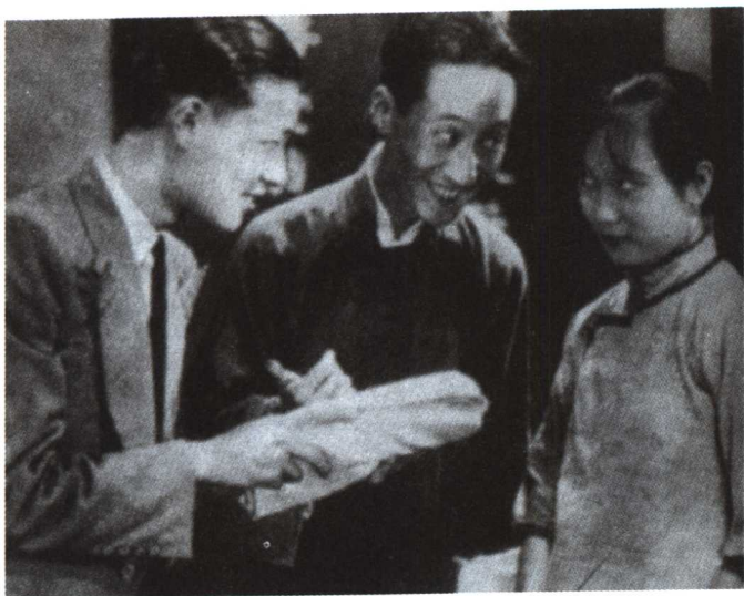
▲首部“左”翼电影《狂流》(1933年)