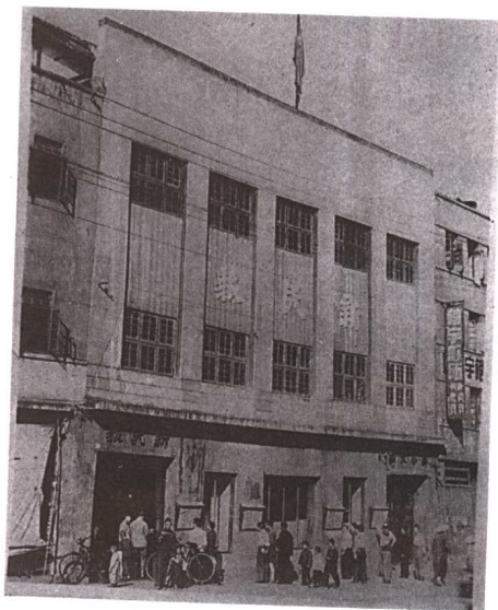
成都盐市口《新民报》社址(1943年)