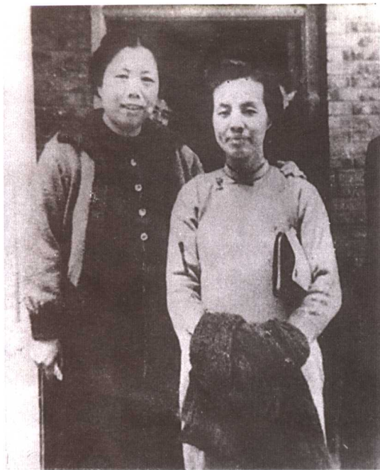
邓颖超、浦熙修合影