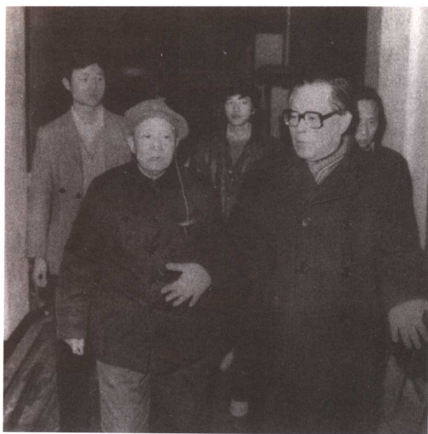
江泽民与赵超构交谈