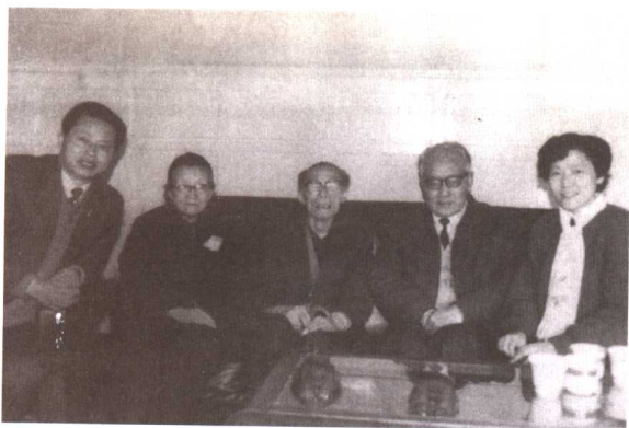
新民晚报部分领导与夏衍、邓季惺在一起交谈。