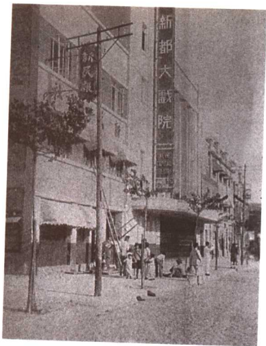
南京新街口《新民报》社址(1929年)