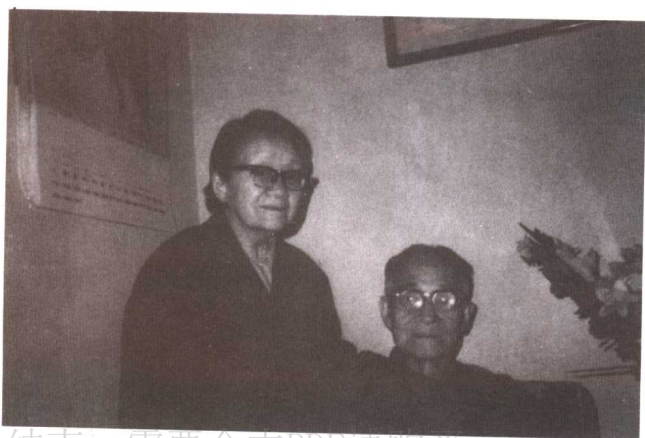
1988年夏七月 最后一次合影