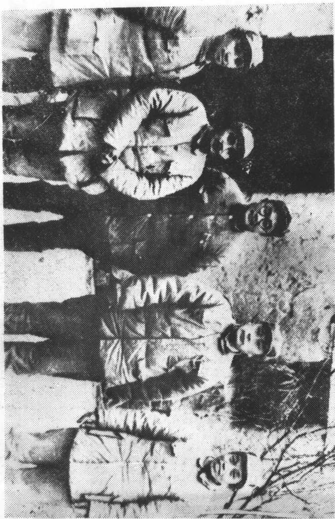
一九四八年十一月十六日中共中央和中央军委命令由邓小平、刘伯承、陈毅、粟裕、谭震林五同志组成总前委，统一领导和指挥华野、中野两大野战军，以徐州为中心与蒋军进行一次决定性战役——“淮海战役”。这是总前委的照片。