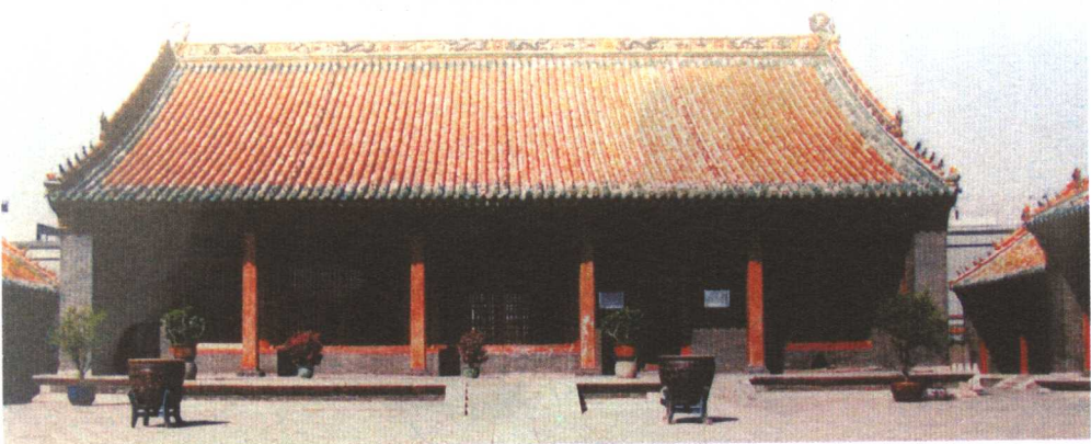
盛京皇宫清宁宫 清太宗皇太极在此崩逝

德五宫后妃四个等级，共生了11个儿子。其中庶妃所生者4人：四子叶布舒(后封镇国公)为庶妃颜札氏所生，六子高塞(后封镇国恣厚公)为纳喇氏所生，七子常舒(后封辅国公品级)为伊尔根觉罗氏所生，十子韬塞(后封镇国将军)为无名氏所生。侧妃所生者1人：五子硕塞(后封承泽裕亲王)为叶赫纳喇氏所生。诸妃所出者3人：长子豪格(后封肃亲王)、二子洛格(早殇)为乌喇纳喇氏所生；洛博会(早殇)为额亦都女、元妃钮祜禄氏生。崇德元年所封五宫后妃生子仅3人：八子(早殇)为宸妃所生，九子福临为庄妃所生，十一子博穆博果尔(后封襄亲王)为贵妃所生。诸子中，除三个儿子幼殇外，其余的是长子豪格36岁，四子叶布舒18岁，五子硕塞17岁，六子高塞和七子常舒均8岁，九子福临时仅6岁，十子韬塞5岁，十一子博穆博果尔时仅3岁。诸子中以长子豪格最为突出，最具竞争皇位的实力，其他皇子当时年龄都还小，最大的也不过十七八岁，他们既没有战功，也没有地位。