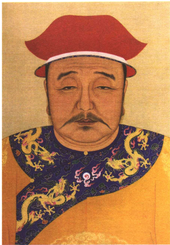
清太宗皇太极吉服像

清崇德三年(1638)正月三十日,在盛京(今沈阳)皇宫的后宫院内,又一位皇子降生了,他就是清太宗皇太极的第九子福临,他的出生为寒冬里漫天大雪肆虐下的皇宫带来了一片喜气。他的生母博尔济吉特氏,即日后清代历史上著名的孝庄皇太后,是科尔沁贝勒寨桑的女儿,崇德元年(1636)被封为永福宫庄妃。