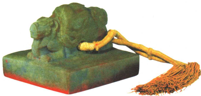
皇太极用“皇帝之宝”