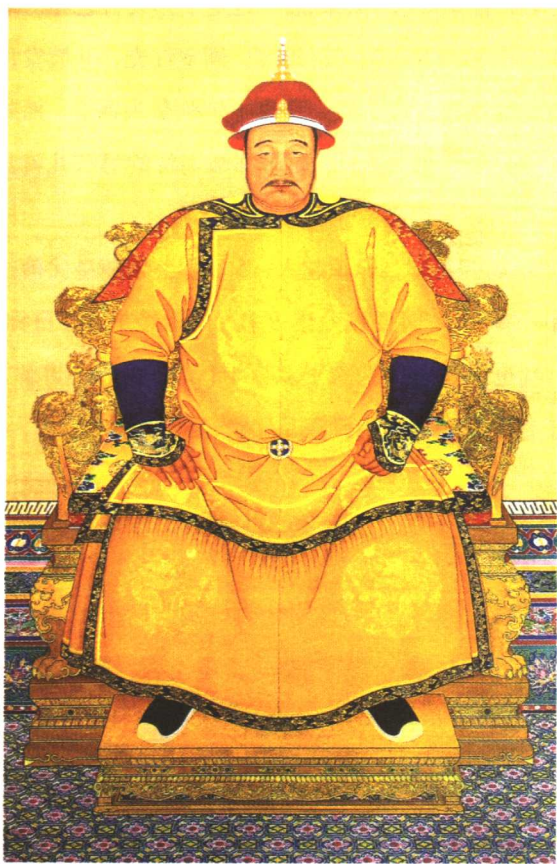
清太宗皇太极朝服像

崇德八年(1643)八月初九日夜里十时许, 52岁的皇太极突然于盛京皇宫中的清宁宫东暖阁南炕上病逝。他死之前, 没有留下任何遗言, 也没有指定自己皇位的继承人。他的突然崩亡, 使满族贵族统治集团突然失去自己的首领, 顿时陷入了群龙无首的状态。于是“继统”问